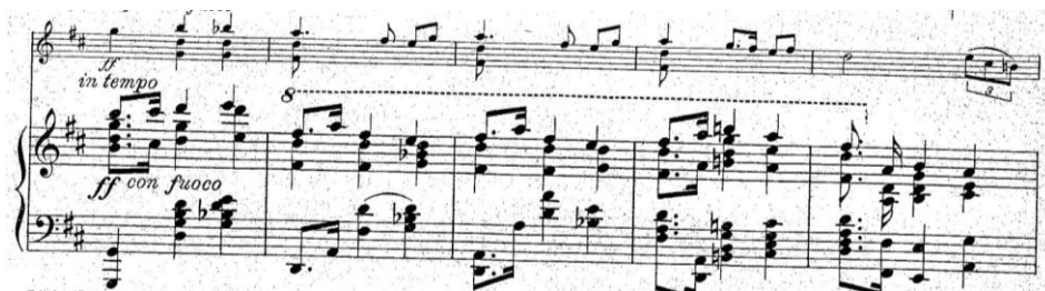
Przykład 8. F. Brzeziński, Sonata D-dur na skrzypce i fortepian op. 6, I część, Allegro moderato , temat drugi w repryzie, takty 232–236.

Repryza powraca do materiału ekspozycji, ale w postaci wariacyjnej. Mazurowy temat drugi przyjmuje nowy kształt: główny motyw zyskuje rytm punktowany (w fortepianie), prowadzony jest też w odmiennym od ekspozycyjnego kontekście fakturalnym, harmonicznym pełniejszym, bez pauz. Skrzypce prowadzą linię kontrapunktującą, z użyciem akordów na pierwszą część taktu. Zmienia się też tryb tonacji (D-dur). W partyturze oznaczony jest adnotacją in tempo con fuoco . W porównaniu z pierwszym ukazaniem w ekspozycji dokonuje się w repryzie transformacja fakturalno-wyrazowa drugiego tematu. Z umiarkowanej w charakterze „przygrywki” przechodzi do postaci pełnego wybrzmienia, z wymianą partii instrumentalnych (melodia – fortepian, towarzyszenie – skrzypce) (przykład 8).