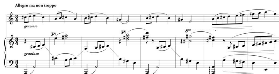
Przykład 14. A. Gradstein, Sonatina C-dur na skrzypce i fortepian , III część, Scherzo – Canon , temat, takty 1–8.

III część, Scherzo – Canon oparte jest na temacie, bardzo pokrewnym do tematu II części. Jego motyw czołowy (powtarzany kilkakrotnie) jest identyczny z motywem poprzedniej części (przykład 14).