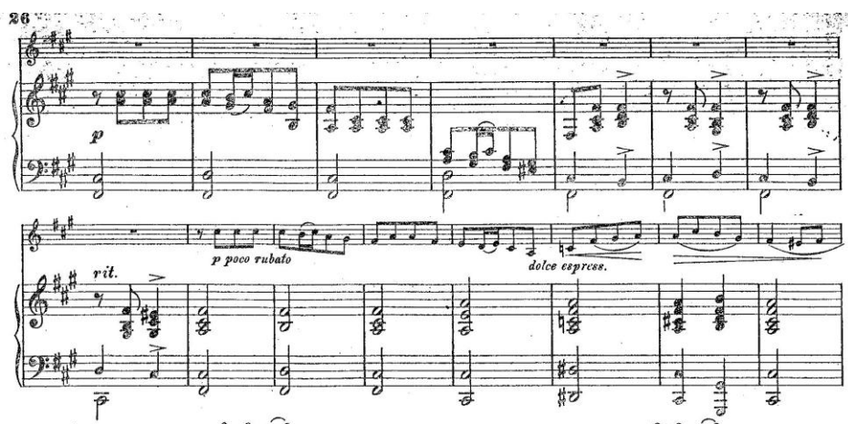
Przykład 2. M. Józefowicz, Sonata d-moll op. 12, III część, Allegro , drugi temat krakowiaka, takty 50–64.

a z niego wynikają zmiany w strukturach melorytmicznych. Jednocześnie następuje ożywienie rytmiczne i zagęszczenie struktur akordowych. Zachowana jest jednak w tym przetworzeniowym procesie formuła synkopy. W repryzie materiał ekspozycji powraca bez większych zmian (drugi temat w h-moll), koda bazuje na materiale pierwszego tematu.