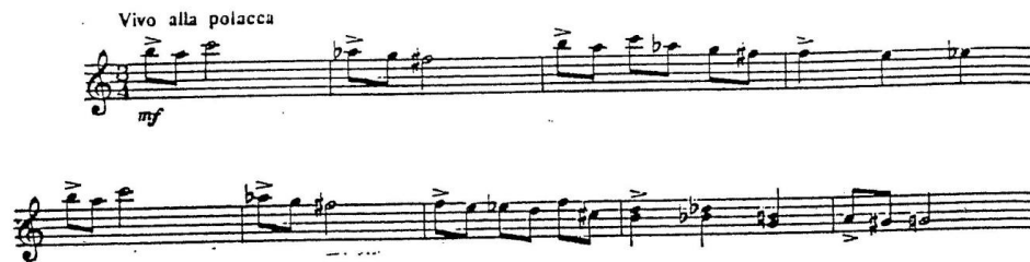
Przykład 20. J. Bruzdowicz, Sonata „Il Ritorno” na skrzypce solo , IV część, Finale. Vivo alla polacca , temat, takty 1–9.

I część, Introduzione. Adagio cantabile , o ciągłej narracji, improwizacyjnym charakterze, jest daleką reminiscencją powolnych, bachowskich „adagiów”, otwierających jego solowe sonaty. II część, Esposizione. Allegro sviluppo , wychodzi od marszowego tematu, rozwijając go w motoryczny tok, według zasady stopniowego zagęszczania ruchu rytmicznego. Moment wyrazowej kulminacji wyraża jeden powtarzany motyw na jednym dźwięku – kompozytorka stosuje tu kulminację poprzez kontrast struktury. Po niej następuje odcinek ad libitum (ametryczny), quasi -kadencja oraz powrót materiału ekspozycji ze zmianami w organizacji wysokości. III część, Intermezzo. Romanca, lento con dolcezza, rubato , w śpiewnej narracji podtrzymuje miarowość rytmiczną, w prostym reprzyzowym ujęciu formy. I w tym kontekście wcześniejszych części następuje IV część, Finale. Vivo alla polacca . Polonezowy temat bazuje – podobnie jak w częściach poprzednich – na miarowej rytmice, z akcentem na pierwszej części taktu (przykład 20).