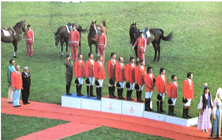
Fot. 3. Podium drużynowego konkursu skoków przez przeszkody (Moskwa, 1980 r.)