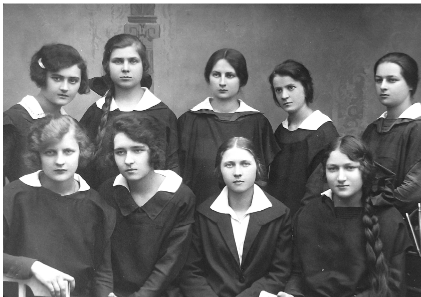
Fot. 1. Uczennice Żeńskiej Szkoły Przemysłowo-Handlowej Sióstr Zmartwychwstania Pańskiego w Częstochowie