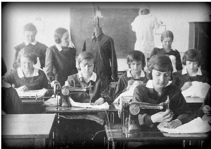
Fot. 3. Dział przemysłowy – krawiecczyzna