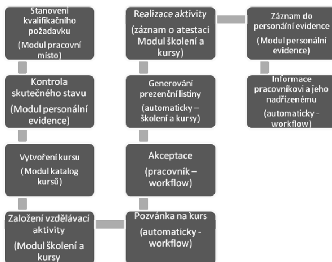
Obrázek 1. Vzdělávací aktivita prostřednictvím PIS

V případě, že vzdělávací aktivita je realizována buď prostřednictvím e-learningové aplikace, kdy mohou být pracovníkovi buď zaslány automaticky údaje pro přístup do této aplikace, nebo přímo odkaz, kterým do ní vstoupí, pokud je autentizace vzdělávacího systému propojena s autentizací do e-mailu nebo do PIS. Systém pak automaticky zaznamená jak průběh vzdělávání, výsledek atestace i vygeneruje osvědčení o absolvování. V případě, že se jedná o kontaktní formu vzdělávání, je po zadání statusu „splněno“ personalistou nebo lektorem kursu proveden záznam v elektronické osobní evidenci, případně generováno osvědčení o absolvování.