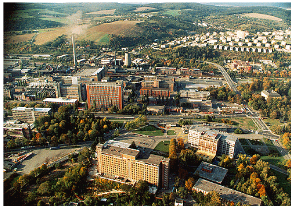
Ryc. 5. Przykład średniej wielkości ośrodka przemysłowego (Zlín, Česka Republika)

Średniej wielkości ośrodki przemysłowe np. Boryslav /Ukraina/; Prešov, Ružomberok /Slovensko/; Zlín /Česka Republika/; Gorlice w Polsce; Bistrița /România/. Grają ważną rolę w krajowych przestrzeniach przemysłowych. Pełnią także inne funkcje, ale przemysł jest najlepiej rozwiniętą gałęzią gospodarki (ryc. 5). Przeważnie charakteryzują się stabilną, dużą wydajnością ekonomiczną i wyspecjalizowanymi zasobami siły roboczej.