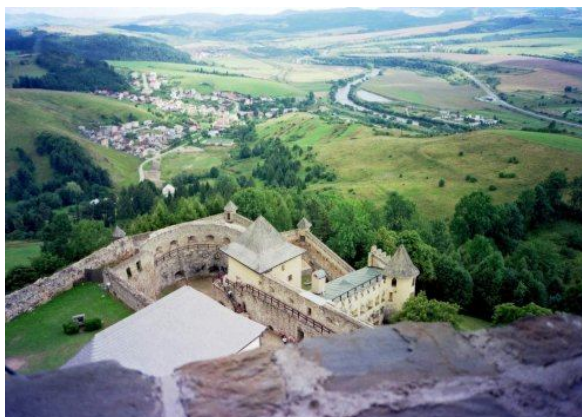
Ryc. 8. Przykład małego ośrodka turystycznego (Stará Ľubovňa, Slovensko)

Oczywiście wśród omawianych ośrodków turystycznych są i takie, które bazują na lokalnych walorach historyczno-kulturowych (ryc. 8). Tak jak średniej wielkości ośrodki turystyczne, małe ośrodki turystyczne mają dobrze rozwiniętą bazę usługową, szczególnie związaną z zakwaterowaniem, gastronomią czy sprzedażą pamiątek. Jednostki te są zróżnicowane pod względem dostępności komunikacyjnej – mogą być ośrodkami o znacznym zasięgu oddziaływania z dobrze rozwiniętym systemem transportowym, lub stanowić lokalną atrakcję o utrudnionym dostępie dla turystów.