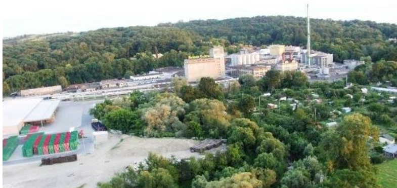
Ryc. 7. Przykład małego ośrodka przemysłowego (Brzesko, Polska)