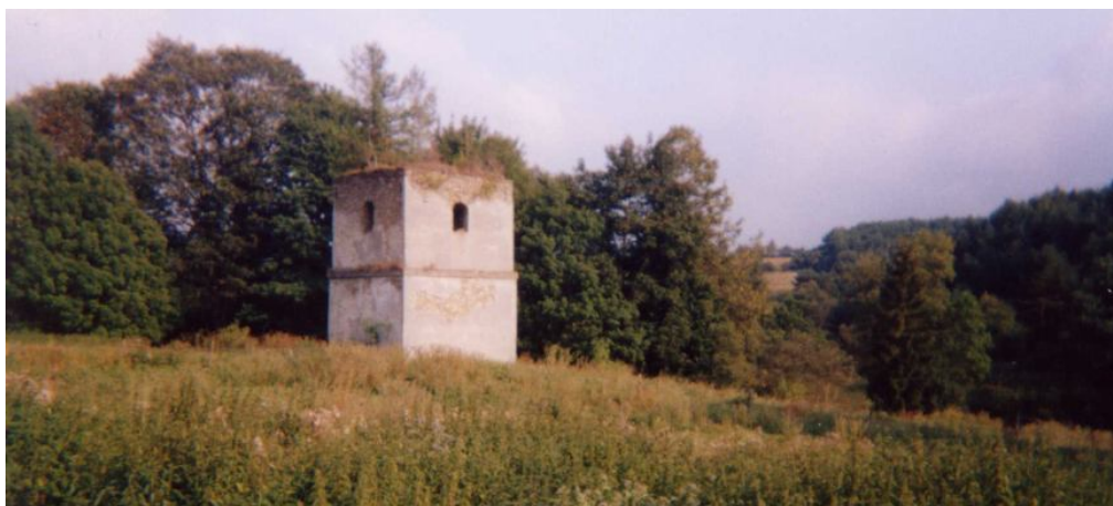
Ryc. 12. Przykład wsi opustoszałej (Polany Surowiczne, Polska)

ludności doprowadziły w okresie powojennym do wyludnienia wielu wcześniej normalnie funkcjonujących wsi (ryc. 12). Większość tych miejscowości została ponownie zasiedlona