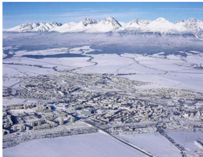
Ryc. 4. Przykład średniej wielkości ośrodka wielofunkcyjnego o dobrej dostępności komunikacyjnej (Poprad, Slovensko)

Charakterystyka. Znaczna liczba miast zlokalizowanych w Karpatach i na przedpolach tego łańcucha górskiego należy do tej kategorii. Mogą pełnić rolę ośrodków europejskich jednostek administracyjnych NUTS III lub NUTS IV, jak również być jednostkami miejskimi o mniejszym znaczeniu lokalnym. Kategoria miast średniej wielkości jest zróżnicowana pod względem profilu działalności (pełnionych funkcji), formy urbanistycznej, dostępności transportowej, warunków środowiskowych itp. Większość omawianych jednostek początkowo rozwijała się jako ośrodki handlu, leżące pomiędzy obszarami o kontrastujących ze sobą warunkach naturalnych. Określono kilka głównych typów jednostek, zaliczanych do miast średniej wielkości.