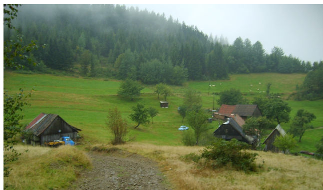
Ryc. 13. Przykład samotnej zagrody (powyżej Homi Becva, Česká Republika)

technicznej jest kosztowne. Dlatego uzasadnione jest stosowanie tu rozwiązań indywidualnych lub grupowych w tym zakresie.