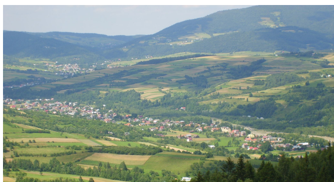
Ryc. 10. Przykład centrum wiejskiego (Kamienica, Polska)

Definicja. Jednostki osadnicze o określonych granicach administracyjnych, nieposiadające formalnego statusu miasta, pełniące rolę centrum administracyjnego nie tylko dla siebie samych, ale również dla innych jednostek o określonych granicach administracyjnych.