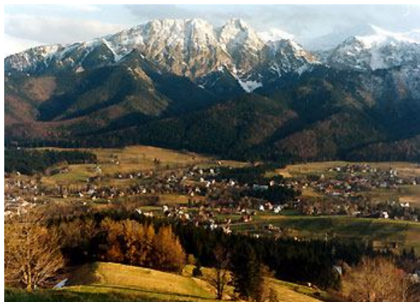
Ryc. 6. Przykład średniej wielkości ośrodka turystycznego (Zakopane, Polska)