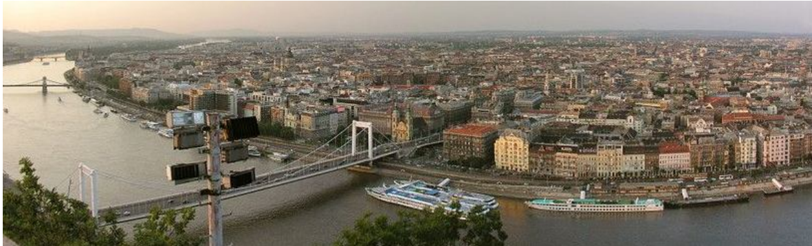
Ryc. 2. Przykład metropolii podkarpackiej (Budapeszt, Magyarország)

arenie międzynarodowej i stanowią bardzo ważne ośrodki Karpackiego Regionu Rozwoju. Ta kategoria miejskich jednostek osadniczych obejmuje kilka wielkich miast, zlokalizowanych na przedpolu Karpat bądź leżących dalej od terenów górskich (ryc. 2). Należą do niej trzy stolice państw leżących w omawianym regionie: Budapeszt, București i Bratislava oraz dwa centra miejskie o mniejszej pozycji administracyjnej, ale o równie istotnym znaczeniu międzynarodowym (L'viv, Kraków).