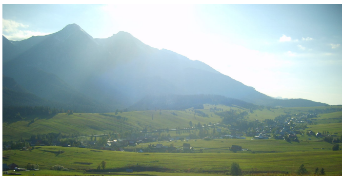
Ryc. 11. Przykład wsi (Ždziar, Slovensko)

Charakterystyka. Wsie są najmniejszymi jednostkami o określonych granicach administracyjnych. Władze samorządowe stanowią tu jednoosobowe lub kolektywne organy o bardzo ograniczonych kompetencjach. Wyposażenie w usługi publiczne lub komercyjne jest ograniczone do usług najbardziej podstawowych, tylko w niektórych dziedzinach. Wsie zwykle znajdują się w zasięgu transportu publicznego, ale często połączenia nie funkcjonują codziennie. Układy przestrzenne wsi wykazują znaczne zróżnicowanie w zależności od rzeźby terenu, struktury własności gruntów oraz od tradycji kulturowych (ryc. 11). Układy te były i są przedmiotem wielu szczegółowych studiów i odrębnych typologii. W Karpackim Regionie Rozwoju występują zarówno wsie o bardzo zagęszczonej zabudowie, w których tradycyjna zabudowa jest niezgodna ze współczesnymi standardami prywatności, jak i wsie o zabudowie bardzo rozproszonej. Dlatego też izolowane grupy domów i samotne zagrody są w niniejszej typologii traktowane jako odrębny typ, pomimo iż znajdują się w granicach administracyjnych wsi.