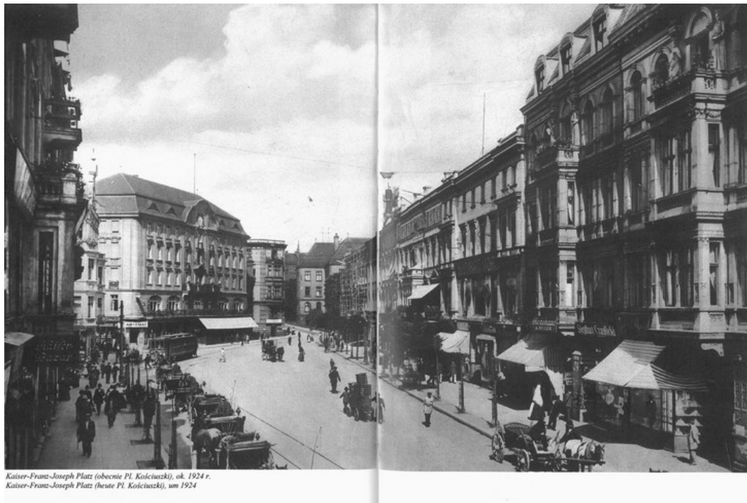
Ryc. 1. Plac Kościuszki w roku 1924