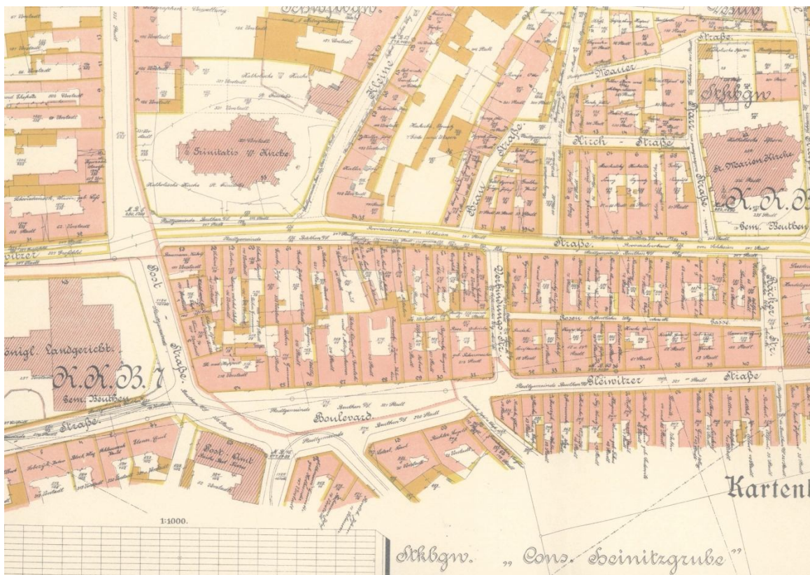
Ryc. 2. Mapa katastralna rejonu placu Boulevard przed rokiem 1918