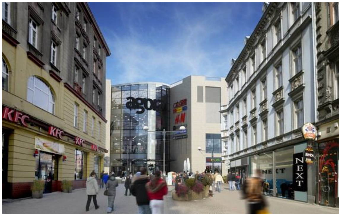
Ryc. 3. Galeria Agora, widok z ulicy Dworcowej

Właśnie na tej osi handlowej zlokalizowany został teren inwestycji, zwany często kwartałem placu Kościuszki, przy którym zbudowana jest Agora Bytom (ryc. 3). Uzupełnieniem tego układu jest trzecia oś – parkowa, z pięknym terenem rekreacyjnym.