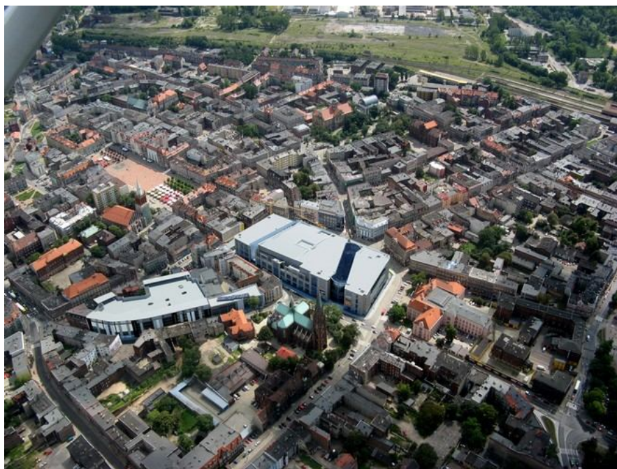
Ryc. 5. Galeria Agora i parking z lotu ptaka

Parkingi dla klientów Agory Bytom umieszczono w sąsiednim kwartale, pomiędzy ulicami Kwietniewskiego, Browarnianą, Webera i Jainty. Parking wielopoziomowy znajduje się bardzo blisko Agory Bytom, prowadzi do niego ul. Browarniana, jedna z typowych, kameralnych ulic centrum Bytomia o niepowtarzalnej atmosferze. Co bardzo ważne, parking posłuży nie tylko klientom galerii, ale także innym użytkownikom centrum miasta.