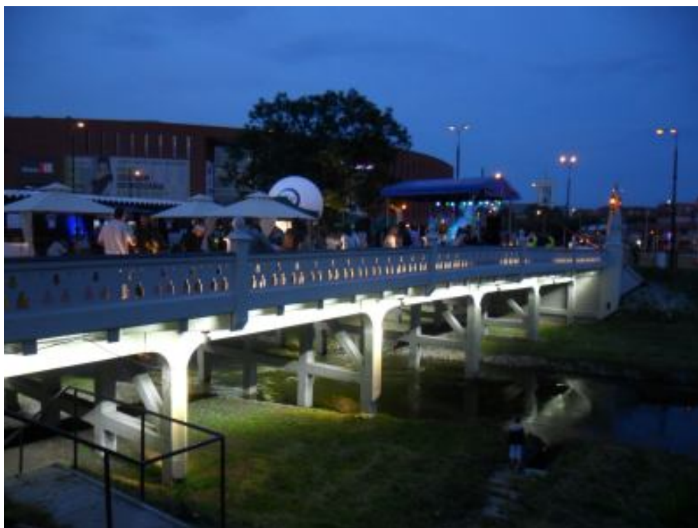
Ryc. 2. Most im. M. Lutosławskiego na Bystrzycy w Lublinie – Most Kultury

Rada Kultury Przestrzeni (organ doradczy Prezydenta M. Lublina) w ocenie koncepcji 3 zwróciła uwagę m.in. na to, że jest ona przygotowana w granicach opracowania jak wyspa. Zauważono ponadto brak wyrazistego wskazania na ochronę walorów przyrodniczych doliny oraz brak konsultacji społecznych, na podstawie których określono by potrzeby rekreacyjne mieszkańców Lublina. Koncepcja została oceniona jako trudny w odbiorze zbiór informacji o uwarunkowaniach i pomysłach. Odpowiedzią władz miejskich na kontrowersyjną koncepcję oraz zapotrzebowanie społeczne ma być dokument obejmujący cały miejski odcinek doliny Bystrzycy, uwzględniający m.in. gospodarkę wodną i ściekową, ochronę przeciwpowodziową i wykorzystanie rzeki do celów turystycznych. W październiku 2012 r. przystąpiono do sporządzenia miejscowego planu zagospodarowania przestrzennego Ekologicznego systemu obszarów chronionych miasta Lublina dla wybranych terenów, położonych w rejonach dolin rzecznych, którego celem jest przede wszystkim ochrona przed przypadkowym, niezgodnym z interesem miasta i jego mieszkańców zainwestowaniem.