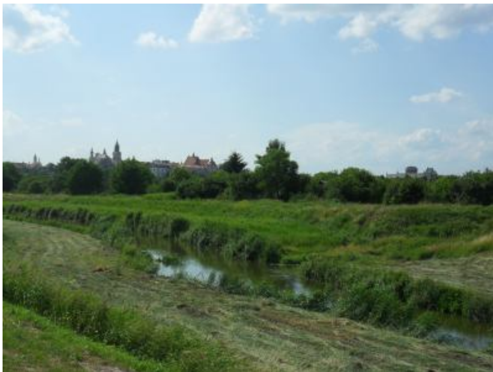
Ryc. 1. Panorama Starego Miasta w Lublinie z doliny Bystrzycy

Dolina Bystrzycy (długość na terenie Lublina 22,5 km, 30,4% całkowitej długości rzeki, szerokość doliny 0,5–1 km) stanowi główną oś przyrodniczą i krajobrazową Lublina, oddzielającą część centralną i północno-zachodnią miasta, położoną na Płaskowyżu Nałęczowskim, od części południowo-wschodniej na Wzniosłości Giełczewskiej. Jest to najmniej zabudowana dolina w mieście, ze stosunkowo dobrze zachowanymi terenami zielonymi. Niewielkie odcinki doliny wykorzystane są przez linie komunikacyjne. W latach 70. spiętrzono wody Bystrzycy tworząc w południowej części miasta Zalew Zemborzycki – potencjalne tereny rekreacyjne, podlegające postępującej degradacji. Rzeka, przepływając przez Lublin, tworzy zróżnicowane relacje przestrzenno-krajobrazowe. Można wyróżnić cztery odcinki, zróżnicowane pod względem nasycenia walorami przyrodniczymi i kulturowymi [Trzaskowska, Sobczak 2007]. Obwałowanie rzeki na znacznym odcinku miejskim spowodowało utratę jej widoczności w krajobrazie miasta. Rzekę możemy oglądać jedynie z 4 mostów, wiaduktu, budynków Politechniki, zabudowy przy ul. Romera i Alejach Zygmuntońskich oraz podczas spaceru lub przejażdżki rowerowej wzdłuż ścieżki spacerowo-rowerowej na wale (ryc. 1).