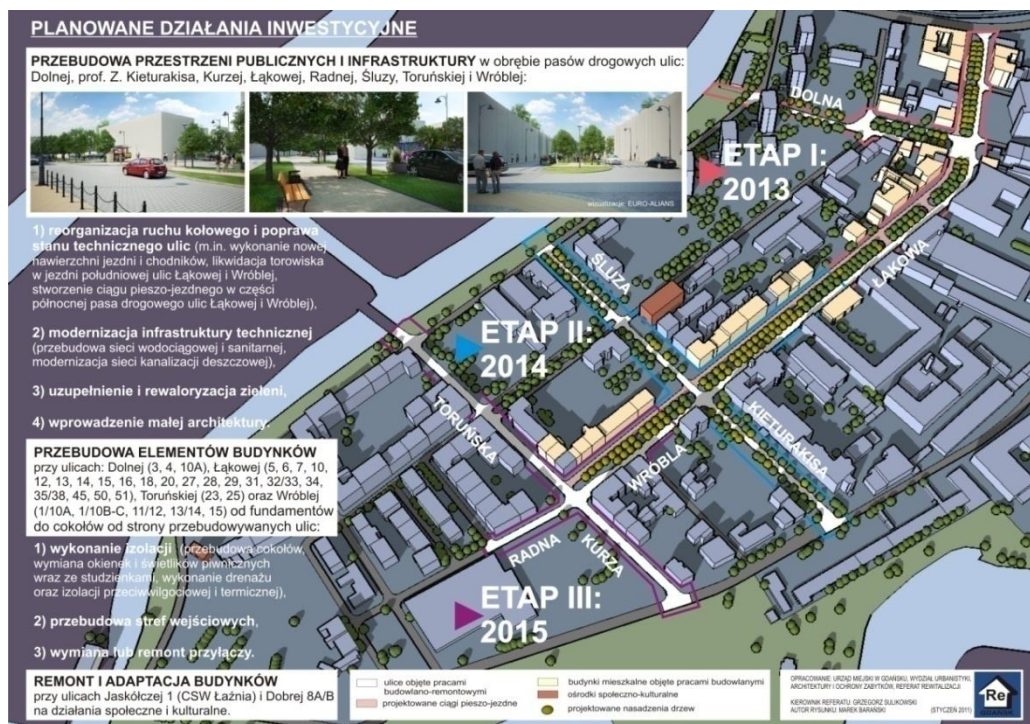
Ryc. 3. Projekt „Rewitalizacja Dolnego Miasta w Gdańsku”: działania inwestycyjne