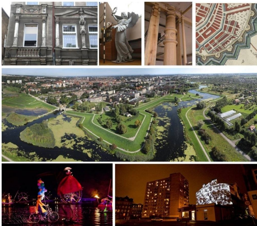
Ryc. 4. Wartości Dolnego Miasta w Gdańsku

Z kolei przy wyborze haseł rewitalizacji skupiono się na tym, aby były one zrozumiałe i elastyczne. Uznano bowiem, że tylko wówczas zadziałają i będą skuteczne w różnych sytuacjach i wobec wielu grup docelowych. Zdecydowano się także na wskazanie i wzmocnienie nie więcej niż trzech lokalnych wartości marketingowych lub też atrybutów,