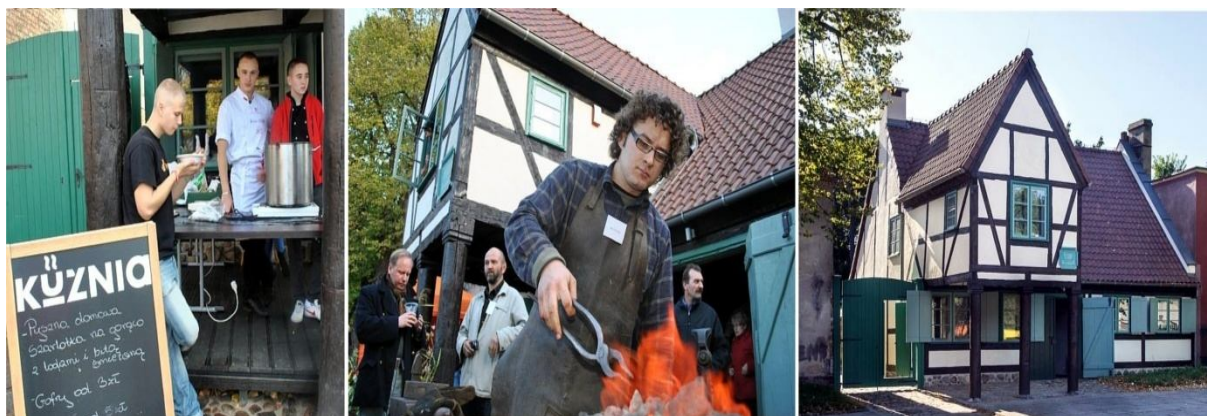
Ryc. 5. Zespół domu podmiejskiego z kuźnią w Gdańsku Oruni, poddany rewaloryzacji w ramach programu rewitalizacji „Orunia ponad podziałami”