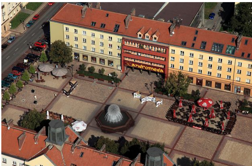
Ryc. 2. Plac Baczyńskiego w Tychach

W rezultacie „nowy” pl. Baczyńskiego stał się jednym z najbardziej reprezentacyjnych miejsc w mieście (ryc. 2). Od maja do września odbywają się tutaj niedzielne imprezy kulturalne, a w grudniu plac jest miejscem kilkudniowego Jarmarku Bożonarodzeniowego.