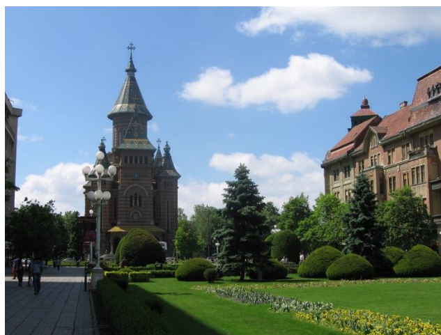
Ryc. 5. Katedra rumuńskiego kościoła prawosławnego w Timișoarze (fot. E. Litwińska)

W północnej części placu znajduje się budynek opery narodowej, a w południowej – okazała katedra rumuńskiego kościoła prawosławnego, fundowana przez króla Michała. Budowano ją w latach 1936–1946 (ryc. 5.). Katedra jest niezwykle ważna dla tożsamości rumuńskich mieszkańców miasta. Wnętrze placu zajmuje skwer z klombami kwiatowymi i fontannami. Stoi tu kopia Lupa Capitolina, wilczycy z Romulusem i Remusem, dar władz Rzymu (1926). Pierzeję zachodnią zajmują wybitne dzieła secesji węgierskiej, m.in. pałace Széchenyiego, Dauerbacha, Hilta i Löfflera.