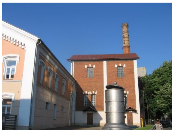
Ryc. 1. Browar

W niektórych projektach rewitalizacyjnych trudno znaleźć rozwiązanie satysfakcjonujące zarówno inwestora, jak i konserwatora zabytków. W 2001 r. na miejscu dawnej rzeźni miejskiej, wybudowanej w latach 1904–1905 i działającej do 1989 r., miało powstać centrum komercyjne. Budowniczym rzeźni składającej się z 11 budynków był ówczesny architekt miejski Laszlo Szekely. Część budynków już nie istnieje, albo została mocno zdewastowana.