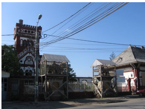
Ryc. 2. Dawna rzeźnia, stan w maju 2012

Najcenniejszym obiektem dawnej rzeźni jest położony naprzeciw wejścia budynek z wieżą wodną, która obecnie pozbawiona jest hełmu. Bramę wjazdową, umieszczoną pomiędzy