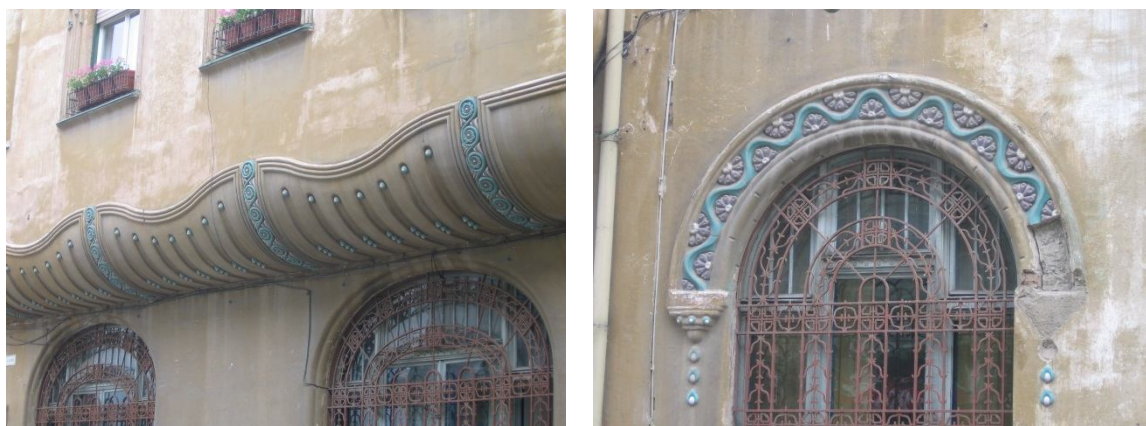
Ryc. 4. Dawny Bank Dyskontowy – detale

Na pl. Jedności (dawniej Katedralnym) ogródki kawiarniane i kamienne ławy wokół trawnika zachęcają do zatrzymania się. Wschodnią pierzeję placu stanowi rzymskokatolicka katedra, zbudowana przez Josepha Emanuela Fischera von Erlacha (1736–1754), syna słynnego architekta wiedeńskiego. Po przeciwnej stronie znajduje się katedra serbskiego kościoła prawosławnego, z którą sąsiaduje siedziba jej biskupa. Pierzeję południową stanowi pałac barokowy, obecnie siedziba muzeum. Na środku placu stoi osiemnastowieczny pomnik wotywny z ukoronowaniem NMP przez Trójcę Świętą. Jedynie zlokalizowany w południowo-wschodnim narożniku budynek dawnego banku dyskontowego, wybitne dzieło węgierskiej secesji (1906–1908), wymaga natychmiastowego remontu. Zdobia go niezwykle piękne, glazurowane dekoracje ceramiczne (ryc. 4.).