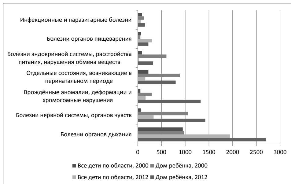
Рис. 1. Заболеваемость детского населения Калининградской области до года некоторыми болезнями, на 1000 детей, 2000 и 2012 гг.

Сравнение показателей здоровья детей первого года жизни, находящихся в доме ребёнка, со средними значениями аналогичных показателей для всех детей области представлено на рис. 1. Частота случаев заболевания патологиями органов дыхания, нервной системы, болезнями эндокринной системы, распространение внутренних пороков развития более значительны у детей из дома ребёнка. Это объясняется объективными причинами – факторами, определяющими попадание детей в этой учреждение. Общая заболеваемость детей первого года жизни, находящихся в доме ребёнка, в 2002 и 2012 гг. более чем в два раза превысила средние значения для региона.