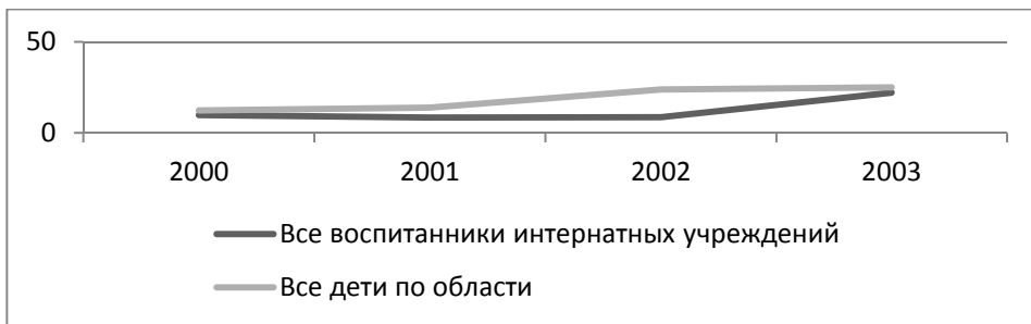
Рис. 2б. Заболеваемость болезнями эндокринной системы детского населения Калининградской области, на 1000 детей, 2000–2003 гг.