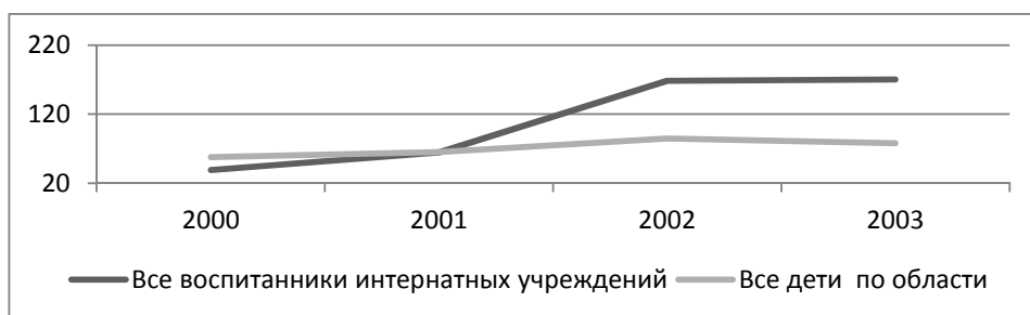
Рис. 3в. Заболеваемость болезнями глаза и его придаточного аппарата детского населения Калининградской области, на 1000 детей, 2000–2003 гг.