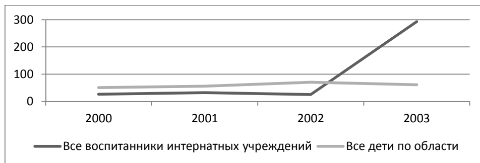
Рис. 3г. Заболеваемость болезнями органов пищеварения детского населения Калининградской области, на 1000 детей, 2000–2003 гг.

Как видно на графике, частота встречаемости болезней органов пищеварения у воспитанников интернатных учреждений значительно возросла после 2002 года.