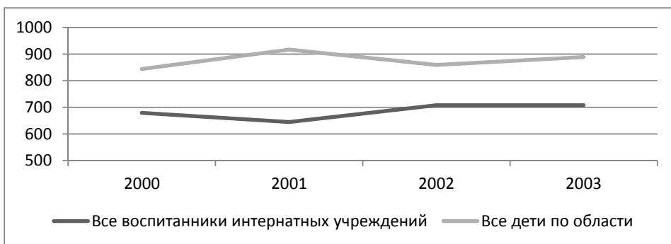
Рис. 2в. Заболеваемость болезнями органов дыхания детского населения Калининградской области, на 1000 детей, 2000–2003 гг.

Заболеваемость болезнями органов мочеполовой системы в целом у детского населения области в 2003 году выше, но в предыдущие три года была ниже, чем показатели, рассчитанные для воспитанников интернатных учреждений.