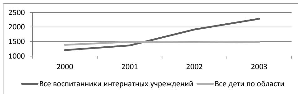
Рис. 3д. Общая заболеваемость детского населения Калининградской области, на 1000 детей, 2000–2003 гг.

Такие различные тенденции могут обосновываться как объективными причинами (среди воспитанников интернатных учреждений часть имеет патологии слуха и зрения, именно поэтому они находятся в специализированном тифло- или сурдоинтернате, например), так и различиями в ситуации обращения за медицинской помощью, взаимодействия с врачом, постановки диагноза ребёнку, живущему в семье или вне её.