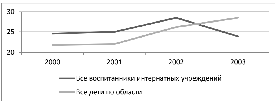
Рис. 2г. Заболеваемость болезнями органов мочеполовой системы детского населения Калининградской области, на 1000 детей, 2000–2003 гг.

Заболеваемость болезнями органов мочеполовой системы в целом у детского населения области в 2003 году выше, но в предыдущие три года была ниже, чем показатели, рассчитанные для воспитанников интернатных учреждений.