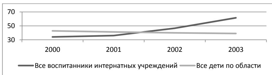
Рис. 3б. Заболеваемость болезнями уха и сосцевидного отростка детского населения Калининградской области, на 1000 детей, 2000–2003 гг.