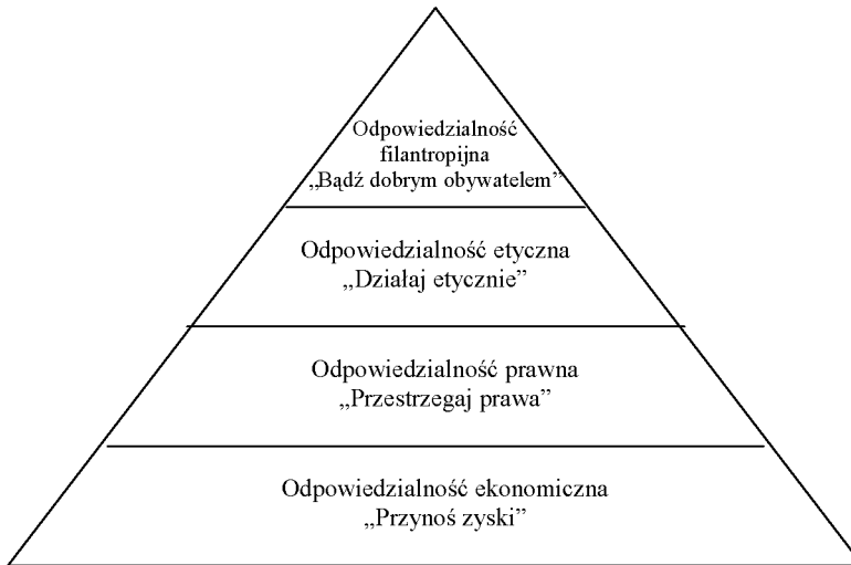
Rys. 1. Piramida odpowiedzialności społecznej