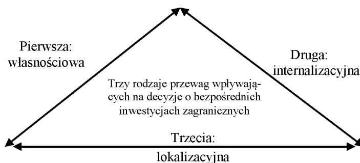
Rys. 2. Rodzaje przewag wpływających na decyzje o bezpośrednich inwestycjach zagranicznych

Na uwagę zasługuje w literaturze eklektyczna teoria opracowana przez J.H. Dunninga 17 , nazwana również paradygmatem OLI: O – ownership ; L – location ; I – internalization . Według tej teorii występują trzy warunki wpływające na decyzje o bezpośrednich inwestycjach zagranicznych, wówczas gdy, firma ma przewagę własnościową z posiadania aktywów lub korzyści, które pozwalają na obniżenie kosztów transakcyjnych wynikających ze wspólnego kierowania aktywami ulokowanymi w różnych krajach. Zakładając, że warunek pierwszy jest spełniony, firma ma przewagę własnościową, wówczas transferowanie korzyści własnościowych z tytułu posiadania aktywów lub korzyści pozwalających na obniżenie kosztów transakcyjnych za granicę wewnątrz własnego przedsiębiorstwa jest opłacalne bardziej niż sprzedaż lub dzierżawa ich do zagranicznych firm. Jeżeli warunek pierwszy i drugi jest spełniony, to dla firmy jest korzystne połączenie tych korzyści razem z czynnikami produkcji na zewnątrz, poza krajem macierzystym. Trzy rodzaje przewag, które wpływają na decyzje o bezpośrednich inwestycjach zagranicznych zilustrowano na rysunku 2