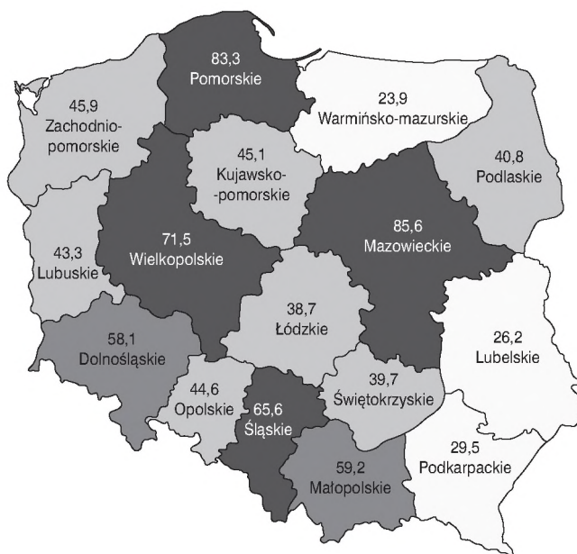
Rys. 2. Poziom syntetycznego wskaźnika rozwoju przedsiębiorczości w Polsce według województw.

W 2010 r. Polska była krajem o największej liczbie nowo powstałych przedsiębiorstw. W całej dekadzie 2003–2012 liczba przedsiębiorstw nowo powstałych była wyższa niż zlikwidowanych (PARP, 2014), co świadczy o dobrych warunkach do podejmowania decyzji o prowadzeniu firm. Przedsiębiorstwa, które uczestniczyły w badaniach, powstały w tym korzystnym dla polskiej przedsiębiorczości okresie. Badane przedsiębiorstwa prowadzą działalność w Wielkopolsce, w regionie, który od lat utrzymuje się z czołowie krajowej województw pod względem syntetycznego wskaźnika rozwoju przedsiębiorczości. Wskaźnik ten zbudowano na podstawie 26 zmiennych dotyczących liczebności przedsiębiorstw, liczby osób pracujących, wielkości przychodów, kosztów i nakładów inwestycyjnych (PARP, 2014). Poziom wskaźnika przedstawiono na rysunku 2.