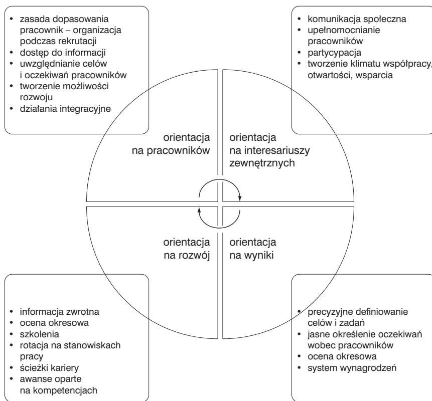
Rys. 2. Praktyki zarządzania zasobami ludzkimi a kluczowe wartości.

ich potencjał i zapewnić, by pracownicy, bez względu na motywację zewnętrzną (nagrody i kary), pracowali z poczuciem misji. Kultura organizacyjna ma być tym elementem integrującym. Powinna tworzyć poczucie przynależności, wspomagać wewnętrzną jedność przez wspólny cel, który pozwala zyskać zaangażowanie pracowników i wzbudzić w nich poczucie tożsamości z organizacją, a praktyki zarządzania zasobami ludzkimi – narzędziami realizacji tego procesu. Implementacja wskazanych praktyk zarządzania ludźmi w organizacjach publicznych to bardzo ważne, a jednocześnie trudne zadanie. Najczęściej bowiem w tego typu organizacjach pozostaje w gestii kadry zarządzającej oraz bezpośrednich przełożonych, którzy nie zawsze dysponują szeroką wiedzą w zakresie wdrażania narzędzi i praktyk ZZL, a jednocześnie są pozbawieni profesjonalnego wsparcia ze strony specjalistów ds. zarządzania zasobami ludzkimi. Zdarza się również, iż skoncentrowani na „twardych” aspektach zarządzania, nie doceniają znaczenia takich czynników jak kultura organizacyjna i zasoby ludzkie. Tymczasem dla