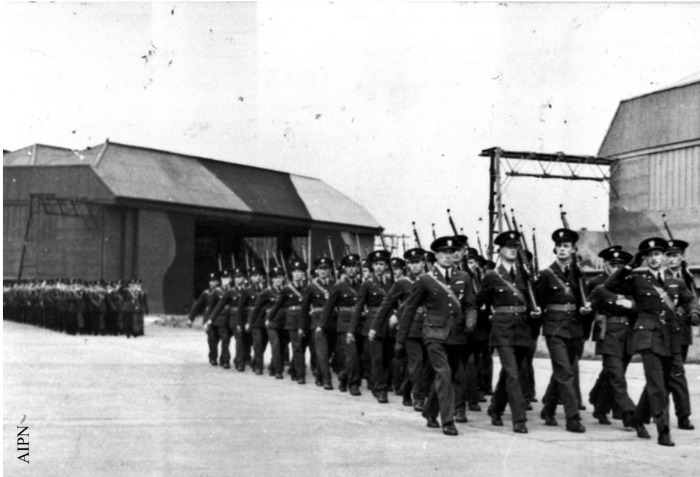
Lotnicy polscy w Wielkiej Brytanii