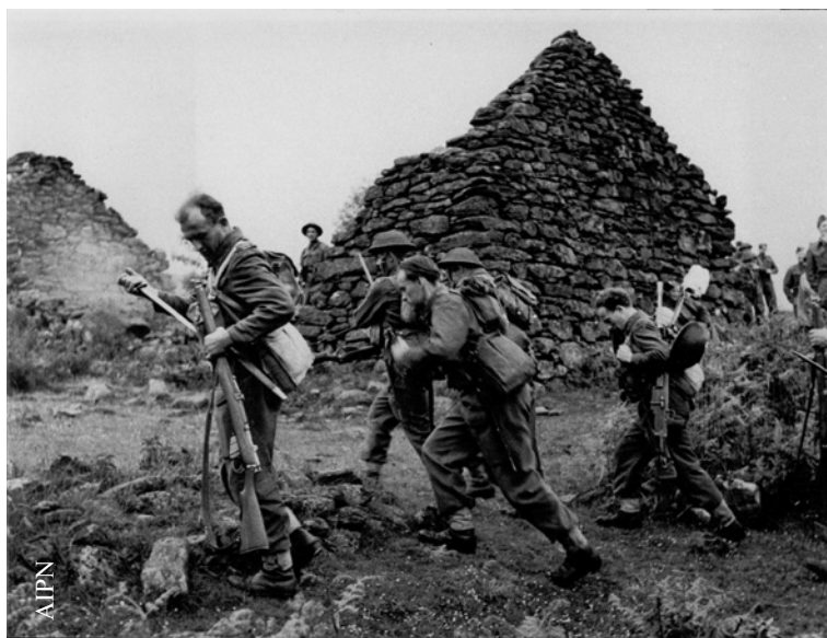
Ćwiczenia polowe polskiej piechoty w Szkocji

Należy podkreślić, że w materiałach dotyczących PSZ, które znajdują się w zasobie BUiAD IPN w Warszawie, odnaleziono jeszcze wiele pojedynczych dokumentów na temat dowódców i wyższych wojskowych służących na Zachodzie. Omówienie wszystkich wymagałoby jednak napisania odrębnego artykułu. Z tego względu wymienione zostały tylko te pozycje, które wydają się najbardziej interesujące.