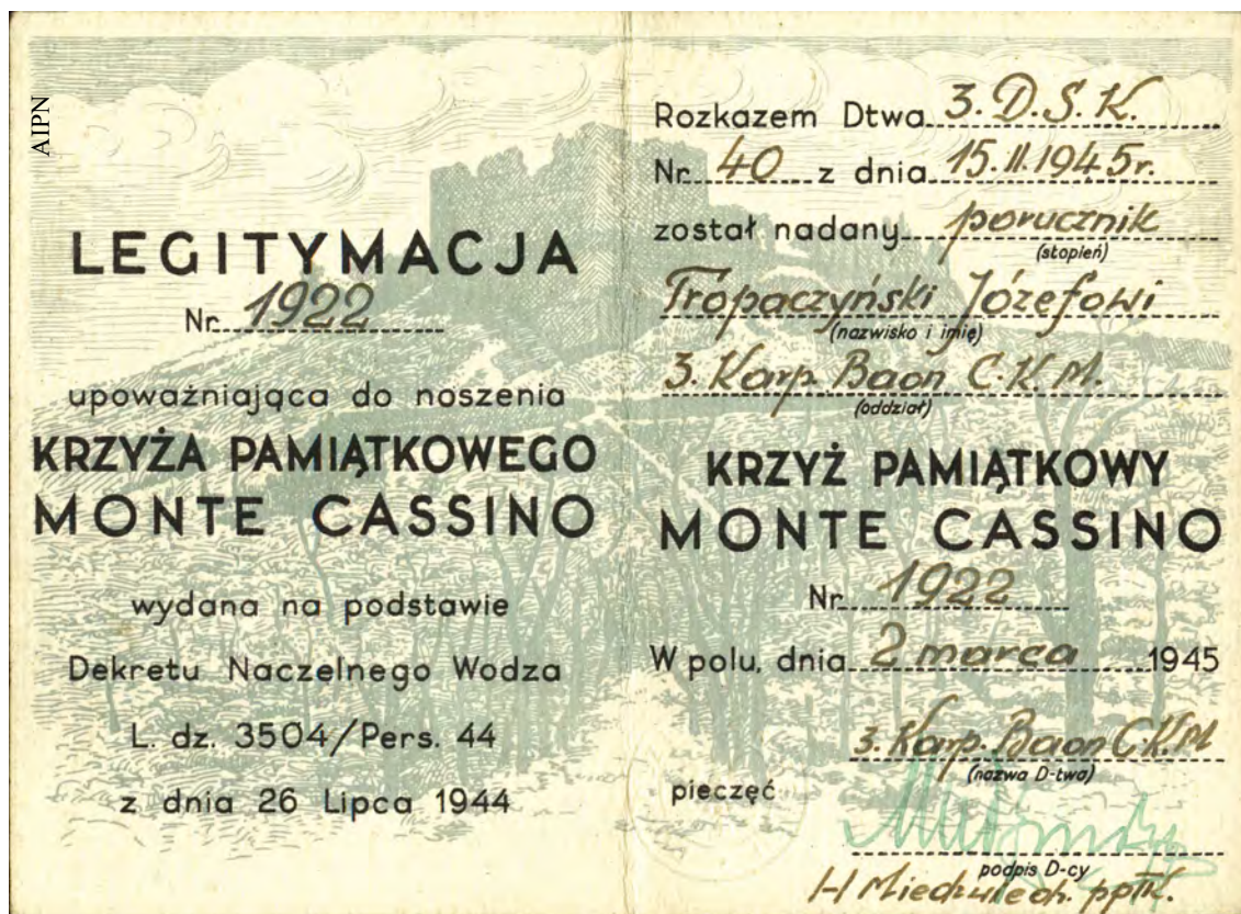
Legitymacja upoważniająca do noszenia Krzyża Pamiątkowego Monte Cassino