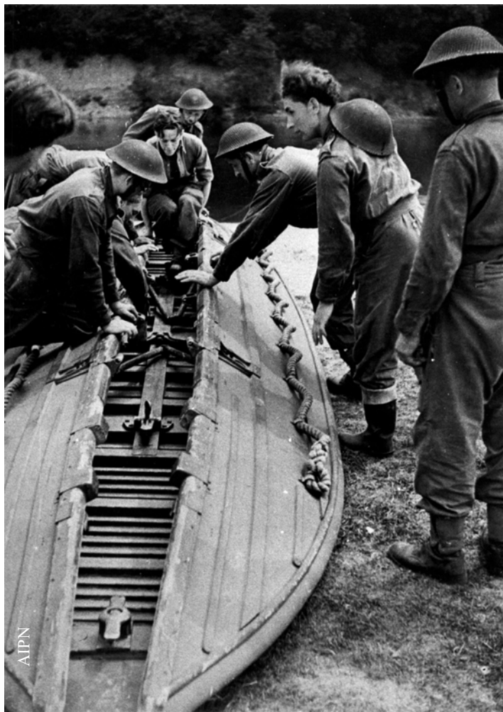
Ćwiczenia polskich saperów w Szkocji