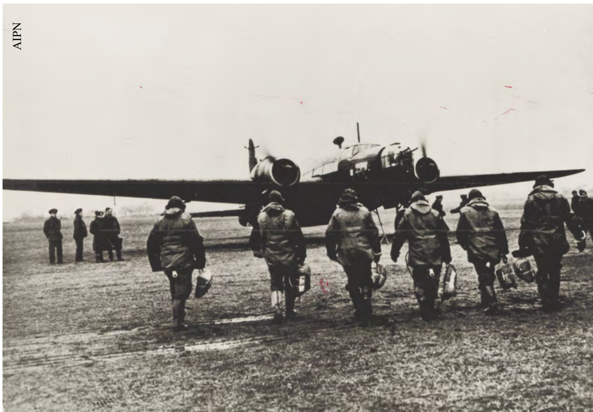
Załoga Dywizjonu 305 przed startem do lotu bojowego