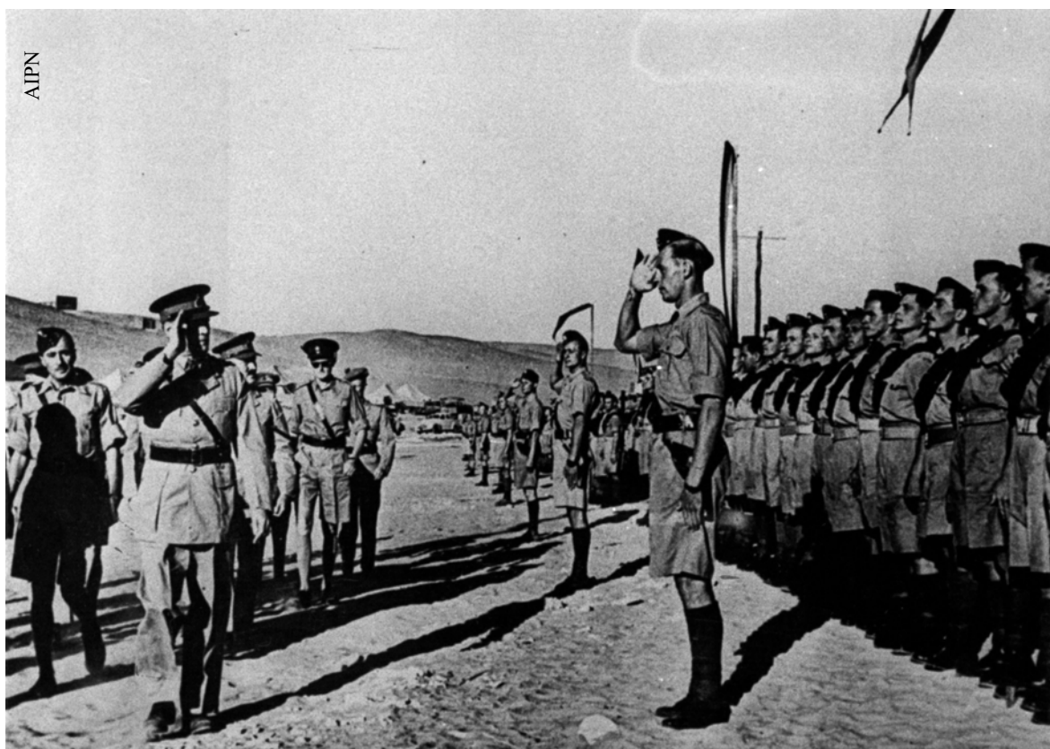
Przyjazd żołnierzy polskich z ZSRR do Palestyny