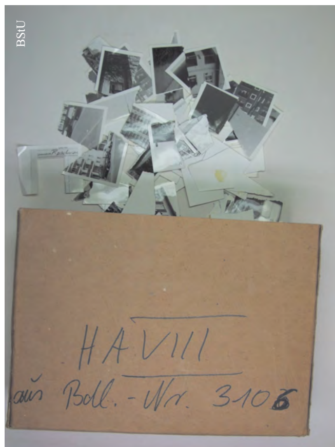
Podarte pozytywy Głównego Wydziału VIII (BStU/AR 7)

W zakresie zabezpieczenia zasobu każdy rodzaj mediów wymaga indywidualnego podejścia. Konieczne są różne strategie, dostosowane do charakteru zasobu. Chodzi tu nie tylko o stan fizyczny archiwaliów, ale także ich rodzaj i pochodzenie. To tu kryje się prawdopodobnie jedna z najistotniejszych różnic w stosunku do archiwów, które nie przechowują dokumentów i innych materiałów wytworzonych przez tajne służby. Zasób nie jest ani uporządkowany, ani należycie opisany i spakowany. Natrafić w nim można zarówno na materiały, które próbowano uprzednio zniszczyć, jak i na całkowicie zmięte negatywy. Zdarzają się też problemy czysto „fotograficzne”.