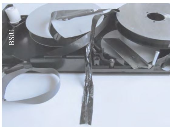
Uszkodzona kasetka VCR zawierająca relację ze spotkania z TW (BStU/AR 7) 6

Od początku lat osiemdziesiątych MfS kładło większy nacisk na obserwację za pomocą wideo i nabywało na Zachodzie odpowiedni sprzęt. Urządzenia wideoprodukcji krajowej można było zdobyć w NRD dopiero pod koniec lat osiemdziesiątych. Zachowało się 1441 filmów wideo z centrali oraz 228 filmów wideo z zarządów okręgowych MfS. W zasobie archiwalnym znajdują się materiały zapisane w dziewięciu różnych standardach, m.in. VCR, UMatic, Video 2000 oraz VHS. Na tę dokumentację składają się filmy pokazujące m.in. imprezy wewnętrzne MfS, obserwacje osób, procesy i przesłuchania. Są wśród nich także filmy szkoleniowe i nagrania programów telewizji RFN. Owe programy – nagrane np. w celu stwierdzenia ewentualnych kontaktów uciekinierów z NRD lub umożliwienia rozpoczęcia dalszych obserwacji – stanowią około dwóch trzecich zasobu materiałów wideo.