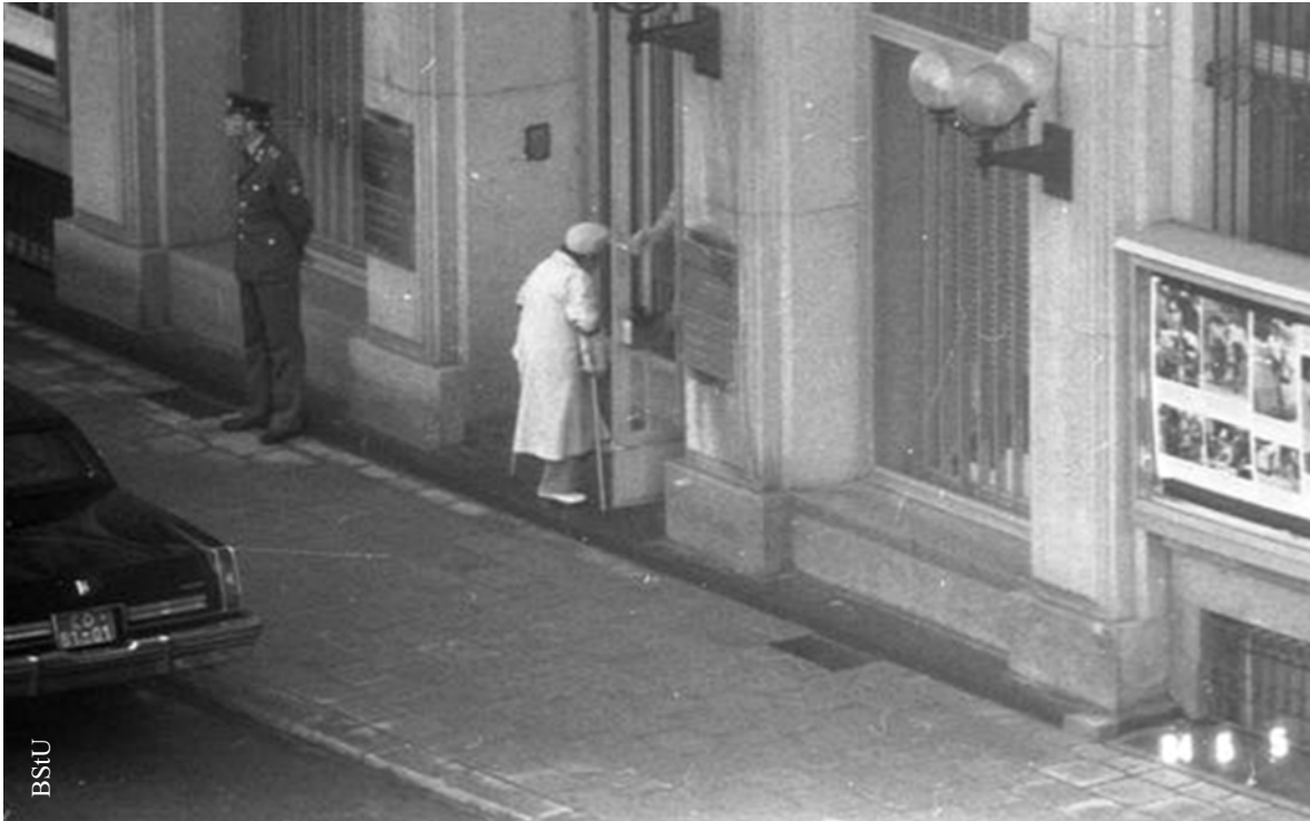
Inwigilacja wejścia ambasady USA w centrum Berlina, 1984 r.

Drugim przykładem inwigilacji jest obserwacja otoczenia Erlöserkirche (Kościoła Zbawiciela – przyp. tłumacza) w dzielnicy Berlin-Lichtenberg (zbiór obejmuje ogółem ok. 4500 negatywów).