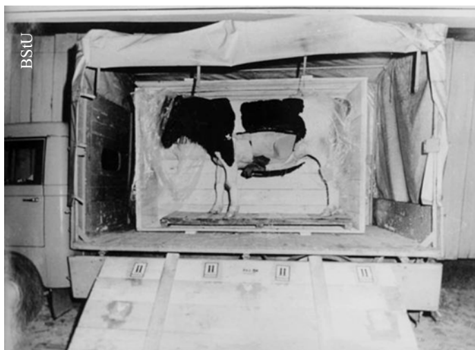
Przejście graniczne w Drewitz, 1969 r.

Sporządzano także dokumentację zdjęciową udaremnionych prób przemytu osób przez granicę NRD. Z jednej strony fotografia była traktowana jako środek dowodowy, z drugiej zaś fotograficzna rekonstrukcja wydarzenia służyła upokarzaniu i zastraszaniu schwytanych osób.