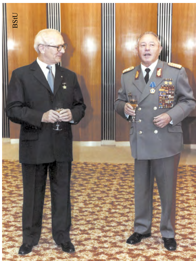
Odznaczenie ministra MfS Ericha Mielke orderem Scharnhorsta, 1985 r.

MfS dbało oczywiście również o obszerne dokumentowanie swej własnej działalności.