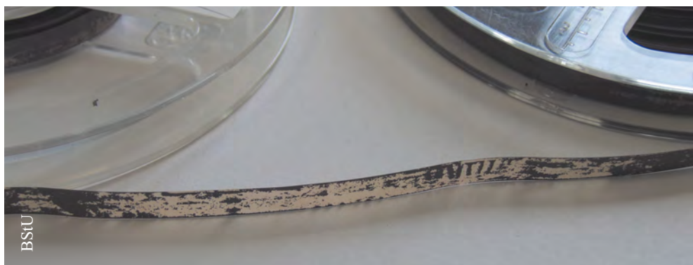
Rozwarstwiona taśma dźwiękowa

Na zasób składają się materiały zapisane w najróżniejszych formatach. Przeważająca część zbiorów dźwiękowych została nagrana z prędkością 2,4 cm/s. Ogólnie jednak waha się ona – w zależności od położenia ścieżki dźwiękowej – między 1,2 cm/s a 76,2 cm/s, a zatem materiały te nie są jednorodne. Poza tym stan techniczny nośników stale się pogarsza.