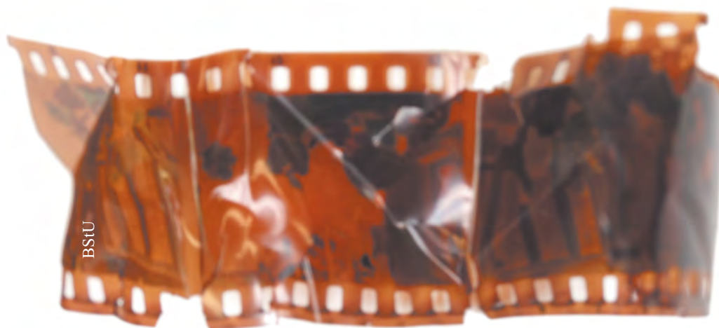
Zmięte negatywy