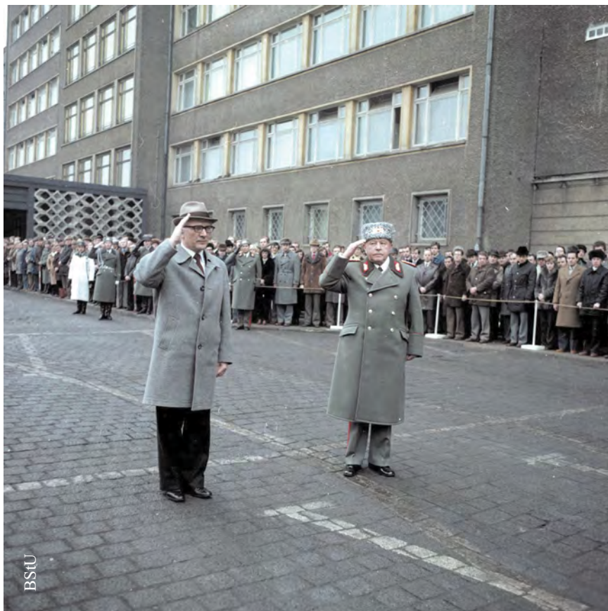
Uroczystość z okazji 30-lecia MfS. Powitanie Ericha Honeckera przez Ericha Mielke na dziedzińcu centrali MfS w Berlinie, 1980 r.