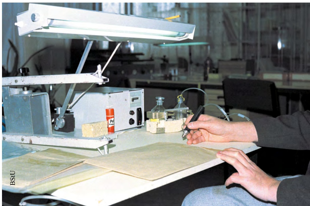
Miejsce pracy i urządzenia do prześwietlania, otwierania, powielania i zamykania przesylek pocztowych, ok. 1986 r.