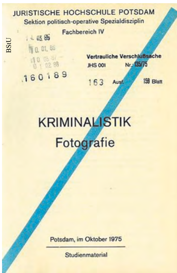
Opracowanie „Kryminalistyka. Fotografia” (BStU/AR 7)

Przykładem tego typu obserwacji jest inwigilacja amerykańskiej ambasady (z lat 1984–1985 zachowało się ok. 93 tys. fotografii).