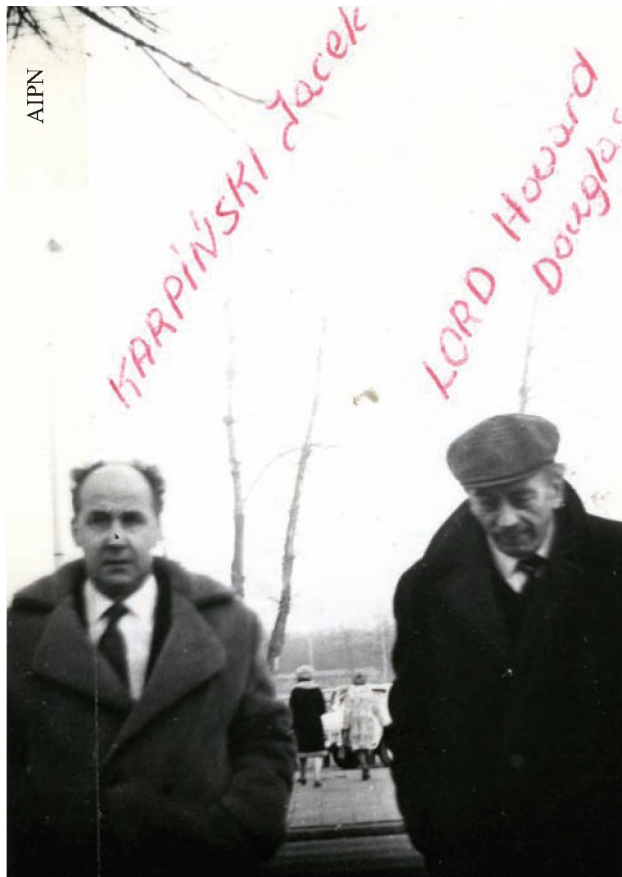
Zdjęcie wykonane 20 XII 1972 r. w Warszawie przez funkcjonariuszy Biura „B” MSW