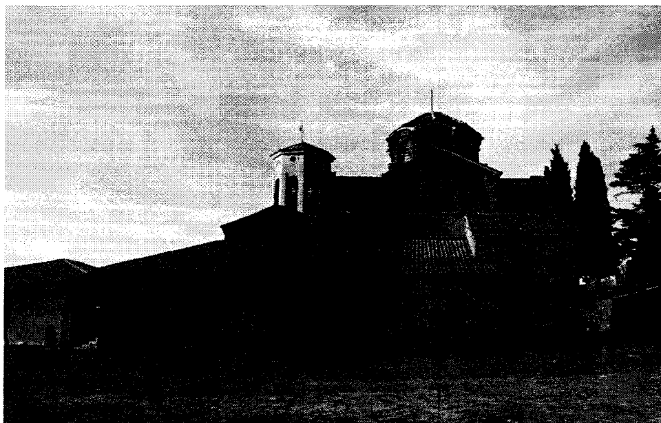
3. Ochryda, Sveta Bogorodica Preslavna (Theotokos Peribleptos), widok od strony południowej, fot. Autor