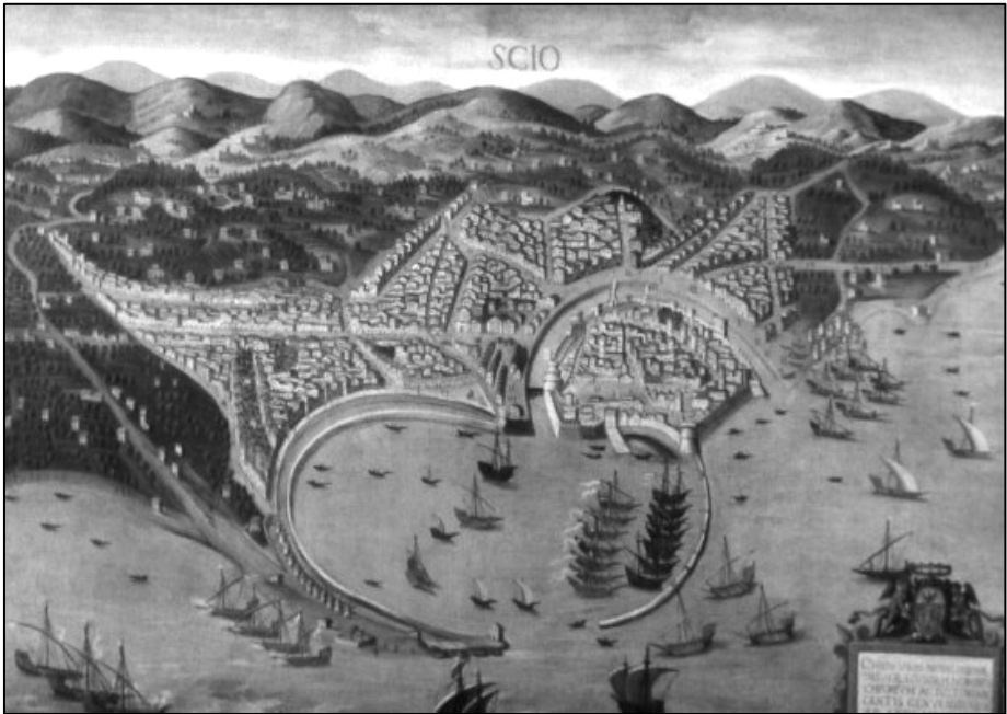
Wyspa Chios, plan z drugiej połowy XVI w. (Genua, Muzeum Morskie)