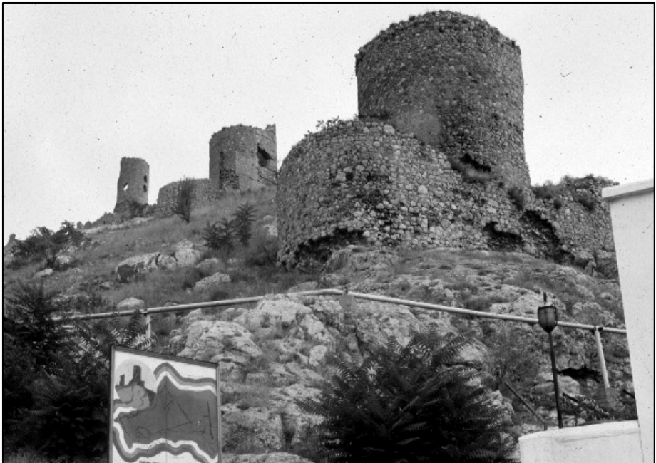
Cembalo – Balakława, forteca genueńska