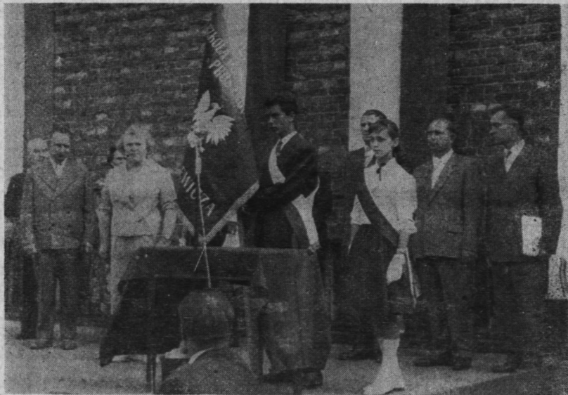
Przekazanie szkole sztandaru ufundowanego przez Komitet Rodzicielski