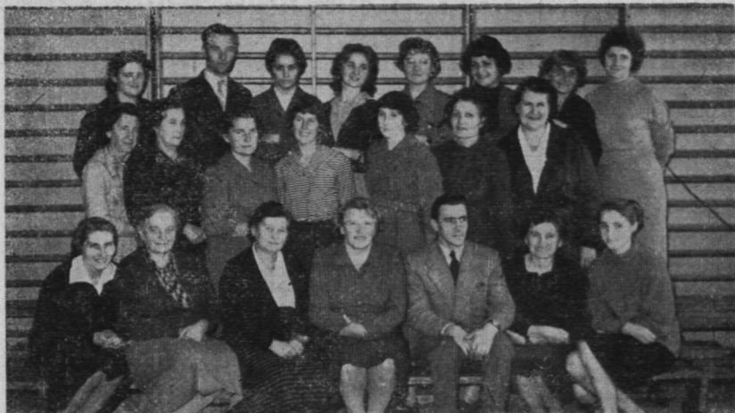
Rada Pedagogiczna Szkoły w roku szkolnym 1960/61