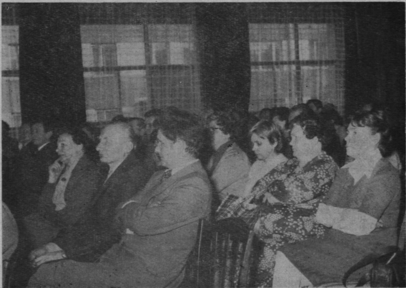
Zdjęcie z sali obrad ostatniej Sesji MRN w Pruszkowie kadencji 1978—84 Foto nr 5 S. Zieliński