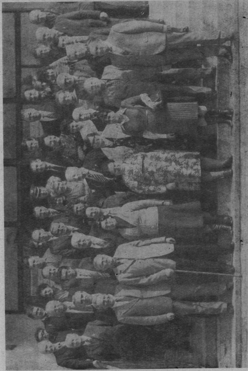
Na fotografii radni Miejskiej Rady Narodowej w Pruszkowie kadencji 1978—84