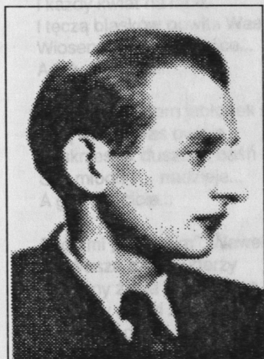
pchor. Włodzimierz Kalinowski ps. „Zorza”