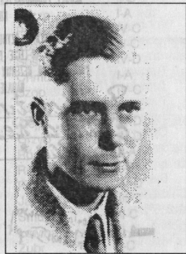
pchor. Olgierd Bujnwid ps. „Ulena”