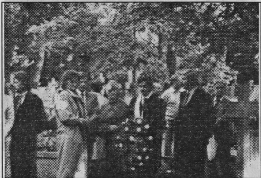
Złożenie kwiatów przez władze miasta pod tablicą pamiątkową

Niezależnie od programu naukowego odbyła się impreza pt. „Dni