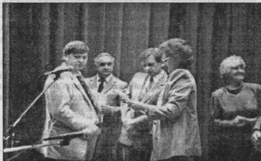
Rozdanie nagród uczestnikom konkursu i spartakiady

wiele dyskusji, których dalszy ciąg miał miejsce w Oddziale Odwykowym.