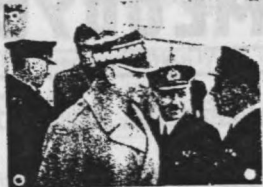
WÓDZ WYPUŁTY... (small text)

"A jeśli ktoś droga otwarta do niśba... (small text)