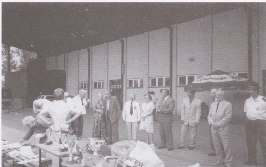
Przed rozdaniem nagród. 1.06.2003

Dni Chwały, klęski oraz Glorii. Złożymy kwiaty, żółte wieńce, Tym co walczyli - w skromnej podzięce. W uszach nam szumi chrzest oręża. Wolność, braterstwo zawsze zwycięża. Dajemy tobie uśmiech miłości, Dzisiaj zapomnij o smutku i złości.