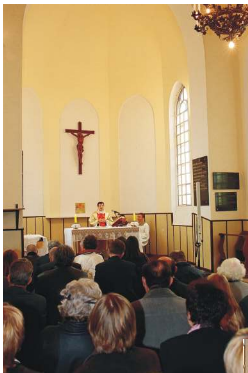
Msza Św. w intencji rodu Korwin Szlubowskich w kaplicy pw. Św. Anny na radzyńskim cmentarzu parafialnym (wszystkie zdjęcia pochodzą z uroczystości pt. "170 lat Korwin Szlubowskich w Radzynie Podlaskim", która odbyła się 2 X 2004 r.).