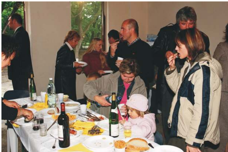
Przyjęcie w parku na Guberni.