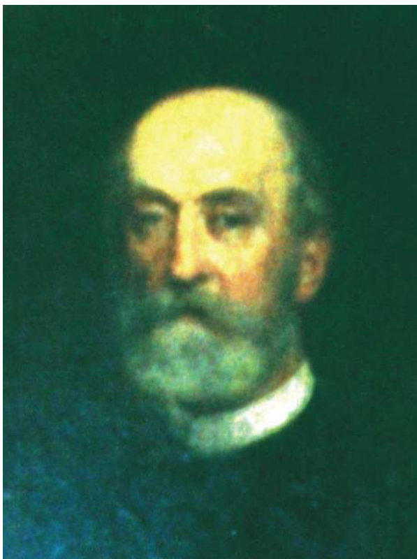
1. Portret Bronisława Korwin Szlubowskiego - ostatniego właściciela dóbr Radzyń.