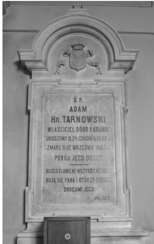
Epitafium Adama hr. Tarnowskiego, kaplica Tarnowskich, zakład A. Pruszyński z Warszawy, po 1851 r., fot. A. Szykuła 2006 r.