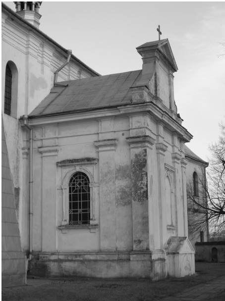
Kaplica Tarnowskich przy kościele p.w. św. Dominika w Łabuniach, po 1871 r., fot. A. Szykuła, 2006 r.