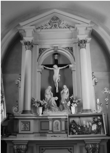
Ołtarz Chrystusa Ukrzyżowanego w kaplicy Tarnowskich, po 1871 r.