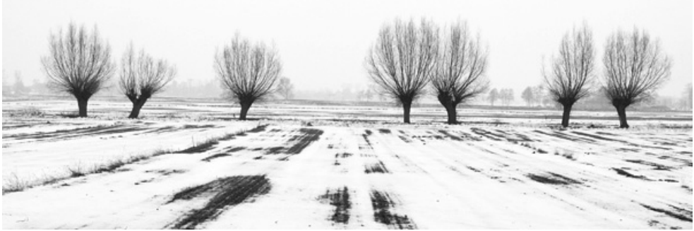
Na bocznej drodze kierowałam się wierzbami

Po przeprowadzce pachciarza nastąpiło przemeblowanie domu. Długa ława z izby powędrowała do mego pokoju – do alkierza, bo miał taką samą długość, a reszta mebli do izdebki, w której zamieszkał teraz gospodarz. Duża izba stała się klasą. Stały w niej ławki, stół, krzesła i tablica. Na ścianach powiesiłam odpowiednie obrazy. W moim pokoju postawiłam przy ławie blaszane łóżko i wiklinowy kosz, który zastępował mi szafę. Taboret przy łóżku uzupełniał moje umeblowanie. W kącie alkierza była kuchnia do gotowania i palenisko chlebowego pieca, z którego gospodyni często korzystała zostawiając na płycie kuchennej kopce wygarniętych z pieca węgla i popiołu. Oprócz mnie, było w tym domu mnóstwo innych sublokatorów, myszy, karaluchy i pluskwy. Z nimi nie mogłam żyć w zgodzie, ale i walka była trudna.