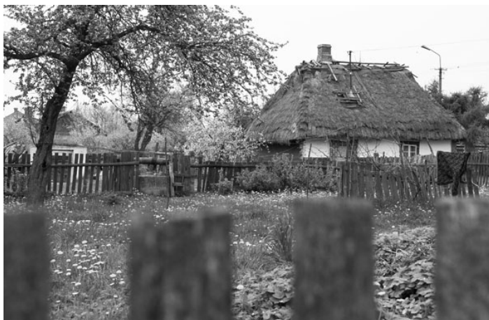
Mijaliśmy chaty pokryte strzechami czarnymi ze starości, rozjaśnionymi gdzieniegdzie zielenią mchu. Niektóre tak wrosły w ziemię, że futryny okien u dołu były na poziomie podwórza

Opiekun szkolny odprowadził mnie do sołtysa. W drodze do niego mijaliśmy chaty pokryte strzechami czarnymi ze starości, rozjaśnionymi gdzieniegdzie zielenią mchu. Niektóre tak wrosły w ziemię, że futryny okien u dołu były na poziomie podwórza. W tyle, za domami stały rzędem podobne do nich stodoły. Studnie z żurawiami zaopatrywały wieś w wodę a poczerniałe koryta służyły do pojenia bydła i koni. Dostęp do studni utrudniały kałuże, a w zimie lodowa powłoka. Spośród zieleni bżów w ogródkach patrzyły w dal krzyże.