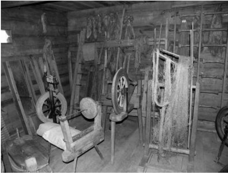
Dziewczęta chodziły z kądzielą i ja z nimi, bo miałam swój kolowrotek (fot. z sieci).

mnie. Za każde zniesione święto kościelne, obdarowywano mnie epitetem „żydówka” i w te dni nie posyłano dzieci do szkoły. Walczyłam z rodzicami spokojnie, dyplomatycznie, aż wreszcie udało mi się ich przekonać, że dzieci mniej nagrzeszą w szkole pod moją opieką, gdy rodzice są w kościele, niż pozostawione same sobie. Pierwsze lody zostały przełamane.