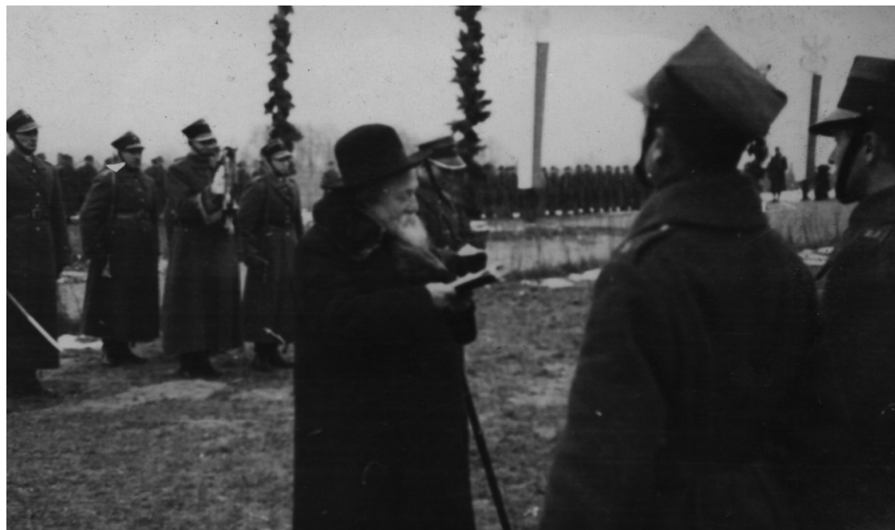
Przysięga Szkoły Podchorążych Piechoty, Iłanie p. Siedlcami, 29 XI 1936, fot. nieznanymi. Archiwum rodziny Ragie- li, udostępniły: Agata Kowalewska, Barbara Bieluga, Maria Jurczak, Jolanta Wierzchowska.