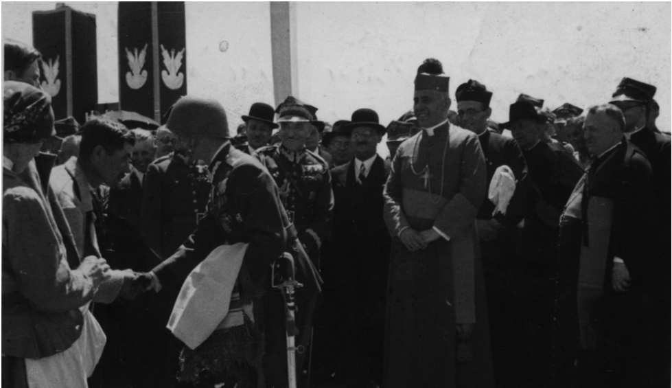
Święto 22 pułku piechoty, Siedlce 12 VI 1937 r.