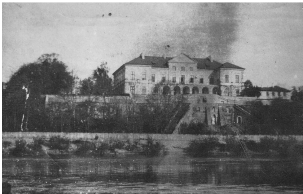
Fot. 2. Widok na pałac w Różance od strony rzeki Bug.

Para ordynacka doczekała się 10 dzieci: 7 synów i 3 córki. Jeden z synów, August Zamoyski, urodzony 18 listopada 1811 r. stał się pierwszym przedstawicielem rodu, który objął dobra włodawskie. Od tego momentu można mówić o włodawskiej gałęzi rodu Zamoyskich 5 . Właściciel odziedziczył dobra na podstawie testamentu z 6 października 1837 r., a ostatecznie przejęcie latyfundium nastąpiło 18 listopada tegoż samego roku 6 . Włodawa i okoliczne dobra były dobrym majątkiem zarządzanym we wzorowy sposób przez Augusta.