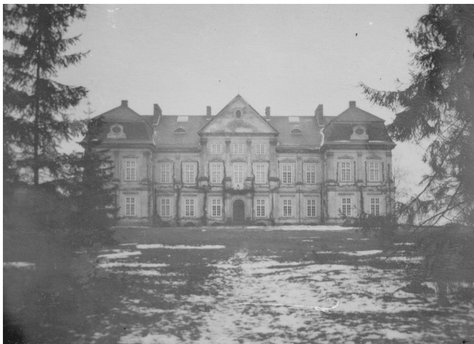
Fot. 1. Widok na front pałacu w Różance (wszystkie zdjęcia pochodzą z „Kroniki pałacowej”).