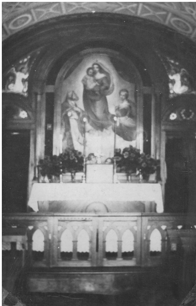
Fot. 7. Obraz Madonny Sykstyńskiej w kaplicy pałacowej w Adampolu.