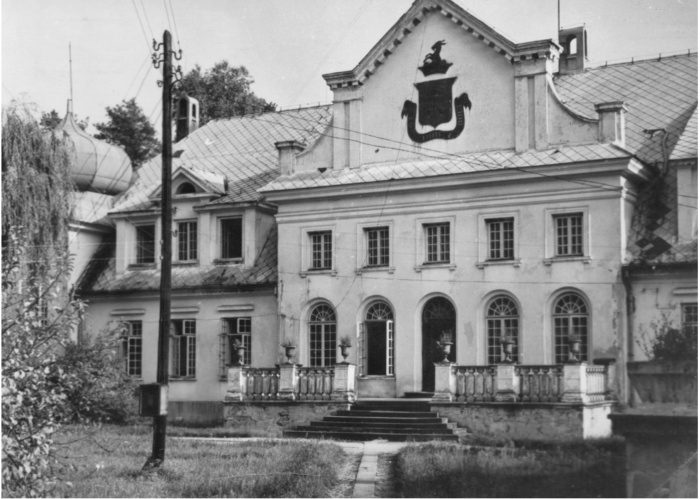
Fot. 4. Widok na część mieszkalną pałacu w Adampolu.