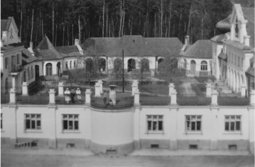
Fot. 5. Widok na dzieciniec pałacu adampolskiego.

Pot występował mu na czoło, ale się modlił spokojnie... A przed oczyma stał jego dom, rodzina, ojciec stary i ten sąsiad straszny, którego postawą stać się mieni najdrożsi, gdyby on już tam nie mógł powrócić.