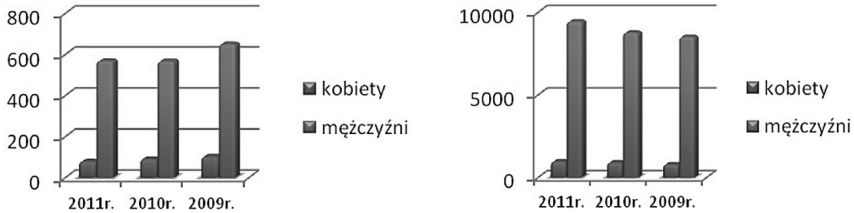
Rycina 1. Szczegółowe zestawienie danych na temat kobiet i mężczyzn podejrzanych o popełnienie przestępstw

Kwestią wymagającą nakreślenia jest dysproporcja w wysokości wyroków za ten sam czyn karalny w przypadku mężczyzn i kobiet, a także znacząca różnica w stosunku liczby osadzonych kobiet do osadzonych mężczyzn.