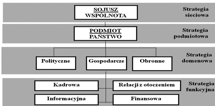
Rys. 2. Przykład rozpatrywania strategii i myślenia strategicznego na czterech poziomach