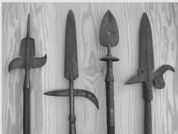
5. Przykłady szpontonów pruskiej armii, będących oznakami funkcji podoficerskich lub oficerskich, XVIII w.

przygasać. Najpierw Rosja a potem Szwecja wycofały się z wojny przeciwko Prusom, a w 1763 r. podpisany został pokój pomiędzy Austrią i Prusami utrzymujący Śląsk przy Prusach 13 . W tym też roku 39. Pułk Piechoty powrócił do Chojny i do 1769 r. stacjonowały tam wszystkie bataliony pułku zakwaterowane w mieście oraz w obozie pod miastem. Od 29 lipca 1763 r. szefem pułku był pułkownik książę Wilhelm Adolf von Braunschweig 14 . W 1770 r. w Chojnie pozostały dwa bataliony i sztab pułku, pozostałe dwa bataliony przeniesiono do Myśliborza i Pyrzyc (batalion grenadierów). W 1770 r. dowództwo nad 39. Pułkiem Piechoty objął generał major Wichard Joachim Heinrich von Möllendorff (późniejszy marszałek), który wykazał się bohaterstwem – jeszcze jako pułkownik – w bitwie pod Lutynią (ryc. 5).