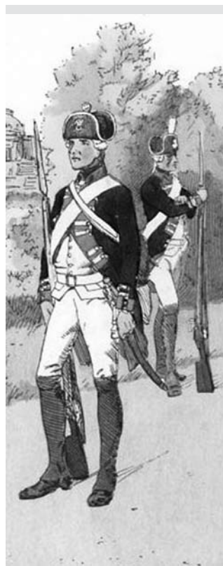
7. Szeregowi żołnierze z 18. Pułku Piechoty.

nic się to jednak nie zdało. 24 października wojska francuskie wkroczyły do Berlina. Kolejne niemieckie twierdze z licznymi załogami poddawały się wojskom francuskim. 28 października pod Prenzlau poddał się wojskom napoleońskim wraz z 10 tys. żołnierzy pruskiej armii Batalion Grenadierów z 18. Pułk Piechoty. III. Batalion tego pułku został rozбитy pod Spandau. Resztki pułku przeszły do gwardii przy Fryderyku Wilhelmie III, który schronił się pod skrzydłami armii rosyjskiej w Prusach Wschodnich. 29 października została podstępem zdobyta twierdza w Szczecinie, 30 października skapitulowało pod Pasewalkiem 6 tys. żołnierzy pruskich, 3 listopada poddała się twierdza w Kostrzynie. Pruska armia była w rozsypce. Zwycięskie wojska francuskie przekroczyły Odrę, kolejne pruskie garnizony w Nowej Marchia zostały zlikwidowane. Chojna została zajęta przez wojska francuskie.