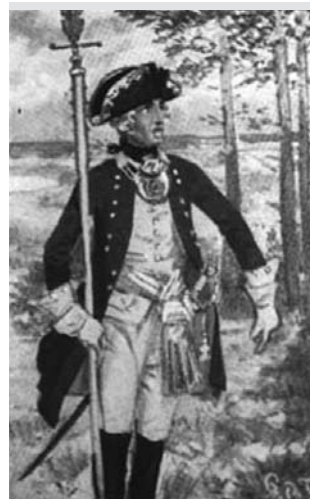
2. Oficer 39. Pułku Piechoty ze szpontonem, XVIII w.

Po opuszczeniu Chojny przez dragonów w następnych latach w historię chojeńskiego garnizonu wpisał się na długie lata 39. Pułk Piechoty Księcia Ferdynanda Brunswickiego (39. Infanterie Regiments Herzog Ferdinand von Braunschweig ) 8 . Pułk sformowano w Templinie w 1740 r. (lub w 1741 r.) 9 i od początku związany był z domem/dworem książąt brunswickich (ryc. 2). Pułk powstał po objęciu tronu w Królestwie Pruskim przez Fryderyka II. Obejmując tron nowy król rozpoczął rządy od powiększenia i tak już licznej armii pruskiej. Do tego czasu, czyli 1740 r., liczyła ona około 80 tys. żołnierzy na którą składało się: 32 pułki piechoty (66 batalionów), 14 regimentów jazdy w tym: 6 regimentów dragonów, 6 regimentów kirasjerów i 2 regimenty huzarów (łącznie 60 szwadronów), ponadto oddziały forteczne,