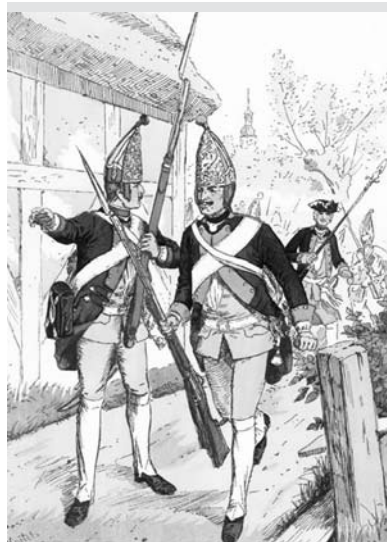
4. Grenadierzy pruscy z okresu wojny siedmioletniej 1756 – 1763

W następnym roku w przegranej przez Fryderyka II bitwie z Austriakami pod Hochkirch 14 października 1758 r. 39. Pułk Piechoty walczył na lewym skrzydle, zabezpieczając odwrót pruskiej armii. Inną bitwą w której pułk się odznaczył, była bitwa pod Legnicą ( Liegnitz ) 15 sierpnia 1760 roku. W następnych latach armia pruska unikała większych bitew, wojna siedmioletnia zaczęła