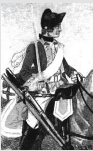
1. Dragon z 3. Pułku Dragonów „Grenadierów Konnych”, XVIII w.

król Fryderyk Wilhelm I nadał regimentowi wyróżniającą nazwę „Grenadierów Konnych” (ryc. 1). Dragoni uzbrojeni byli w pałasze – broń sieczną o prostej głowni z rozbudowaną półkoszową rękojeścią. Pałasz służył głównie do przełamujących uderzeń z góry. Ponadto uzbrojeni byli w parę pistoletów i karabinek z bagnetem noszony na pasach zaczepiony o antabę. W Chojnie znajdowało się wówczas około 280 domów, wśród których zakwaterowano żołnierzy. Dragoni jednak nie przebywali w Chojnie długo i już 1 grudnia 1718 r. odjechali do Schwedt 4 . Był to czas III Wojny Północnej (1701 – 1721) 5 . Na tronie pruskim zasiadał Fryderyk Wilhelm I zwany „królem-sierżantem”, za rządów którego rozbudowano i zunifikowano pruską armię, która była oczkiem w głowie władcy. W Prusach rządzonych przez Fryderyka