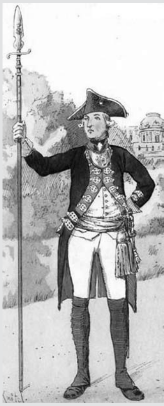
6. Oficer z 18. Pułku Piechoty ze szpontonem.