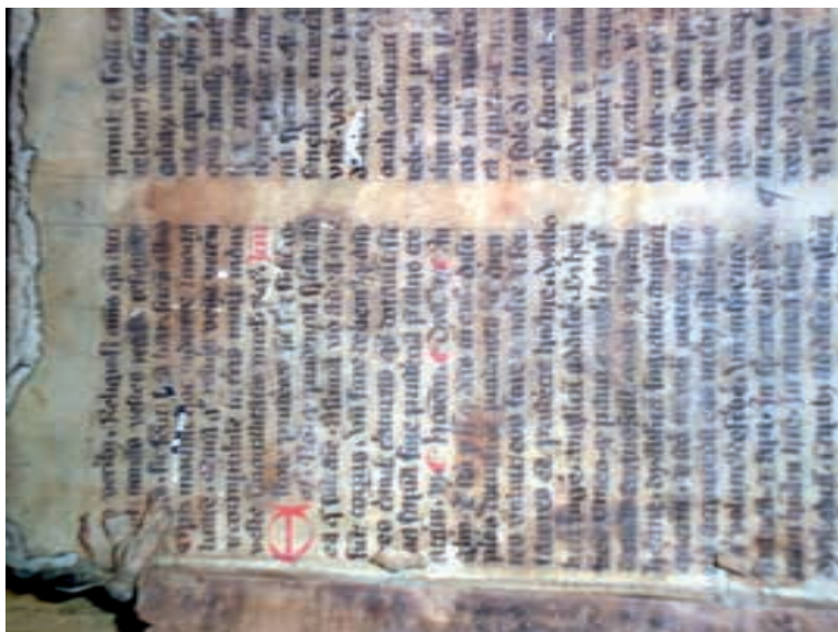
Fragment ręcznie pisanego pergaminu, który stanowił wzmocnienie oprawy woluminu