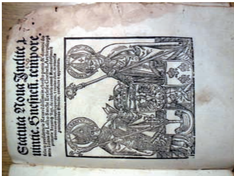
Strona tytułowa drugiej części „Statutów”