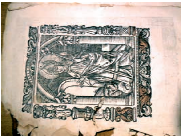
Drzeworyt ze składki A4v przedstawiający św. Stanisława wskrzeszającego Piotrowina