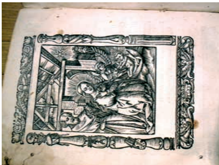
Drzeworyt ze składki A4v przedstawiający scenę Narodzenia