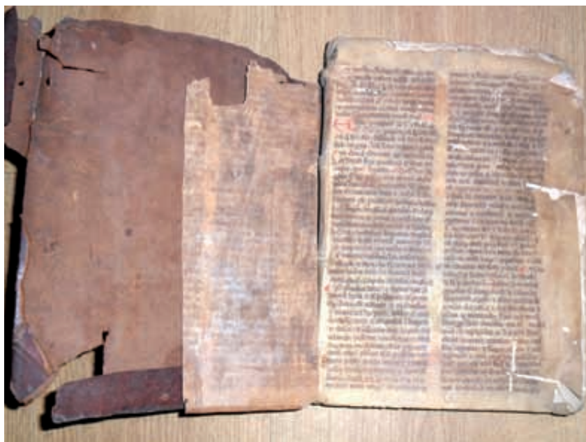
Zniszczona okładzina wierzchnia, resztki deski oraz ręcznie pisany pergamin