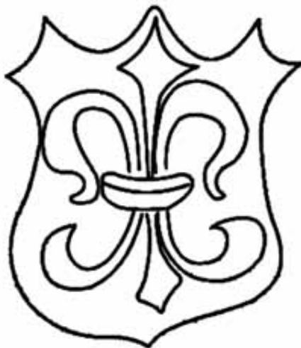
Rys. 1. Znak wodny odbity z kart „Statutów”

oznaczenia kolejności składek służą sygnatury literowe i reklamanty. Format egzemplarza to 4 o [„czwórka”] 15 . Wolumin został wydrukowany na papierze czerpanym o lekko kremowym zabarwieniu. Na wielu kartach odnaleziono filigran z motywem kwiatu lilii (rys. 1). Na podstawie analiz porównawczych stwierdzono, że tego typu znak wodny używany był w piapierni w Nysie na Śląsku 16 .