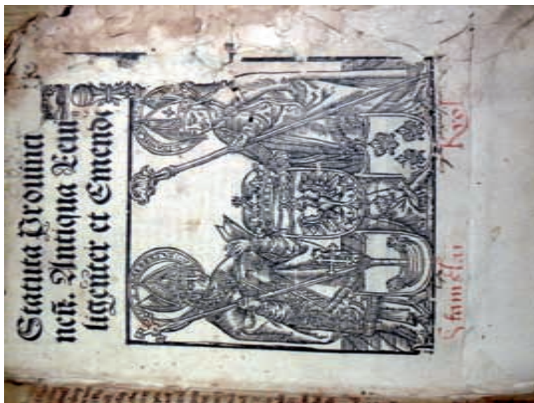
Strona tytułowa pierwszej części „Statutów”