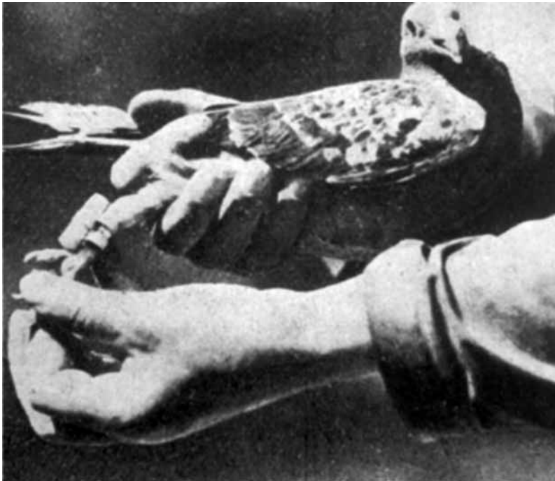
Tuleja z meldunkiem przytwierdzona do nogi gołębia pocztowego.

Gołębie pocztowe przenosiły meldunki, które zwijano w tuleję ce przymocowanej do prawej nóżki gołębia, a następnie zwierzę wypuszczano. Według cytowanej instrukcji meldunek odbierał opiekujący się gołębiami pielęgniarz i oddawał komendantowi gołębnika 17 .