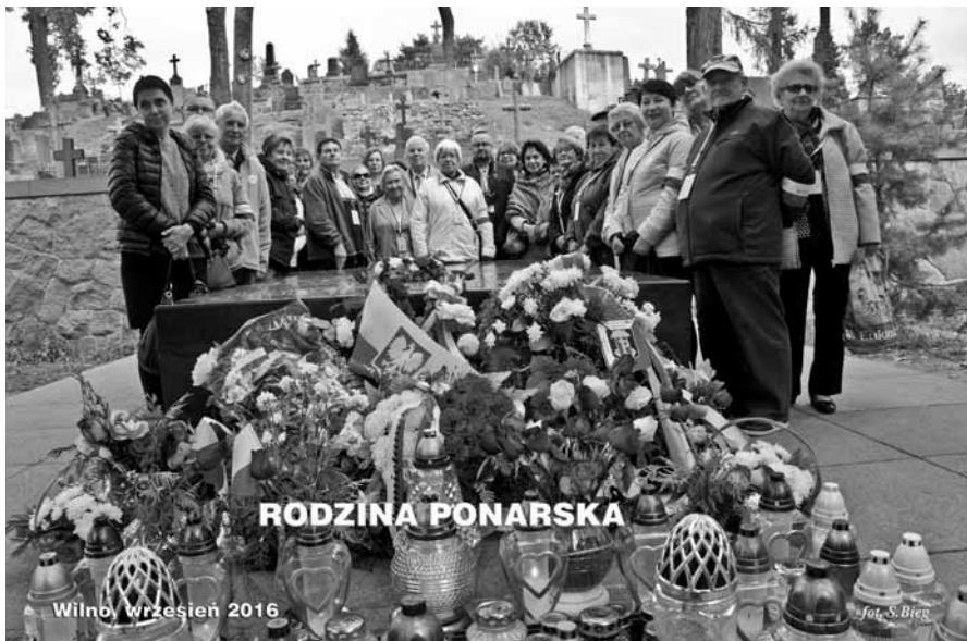
Członkowie SRP z przewodniczką przy Mauzoleum Matki i Serca Syna na Rossie