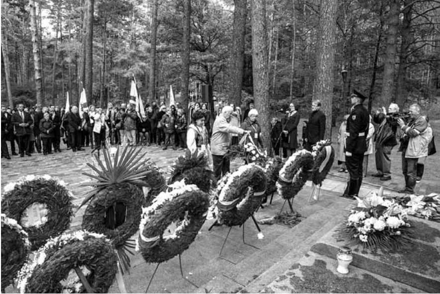
Składanie kwiatów przez członków Stow. Rodzina Ponarska pod Pomnikiem Żydowskim w czasie oficjalnych państwowych uroczystości Dnia Zagłady Żydów

oraz obejściu Alei Pamięci Narodowej, gdzie co roku przybywa kilka steli, udaliśmy się w drogę powrotną do Wilna z postojem w Powiewórcie przy zabytkowym Kościele p.w. św. Kazimierza, w którym był ochrzczony Marszałek.