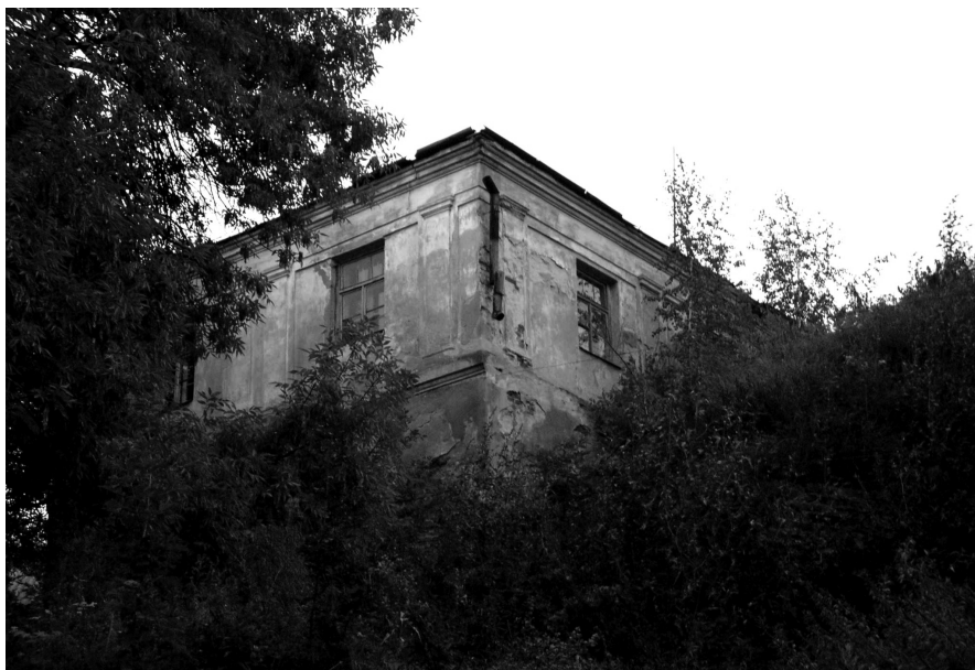
Obecny stan otoczenia zamku Radziwiłłów w Ołyce – widok z dna dawnej fosy. Fot. Aleksander Smoliński, lipiec 2006 r.