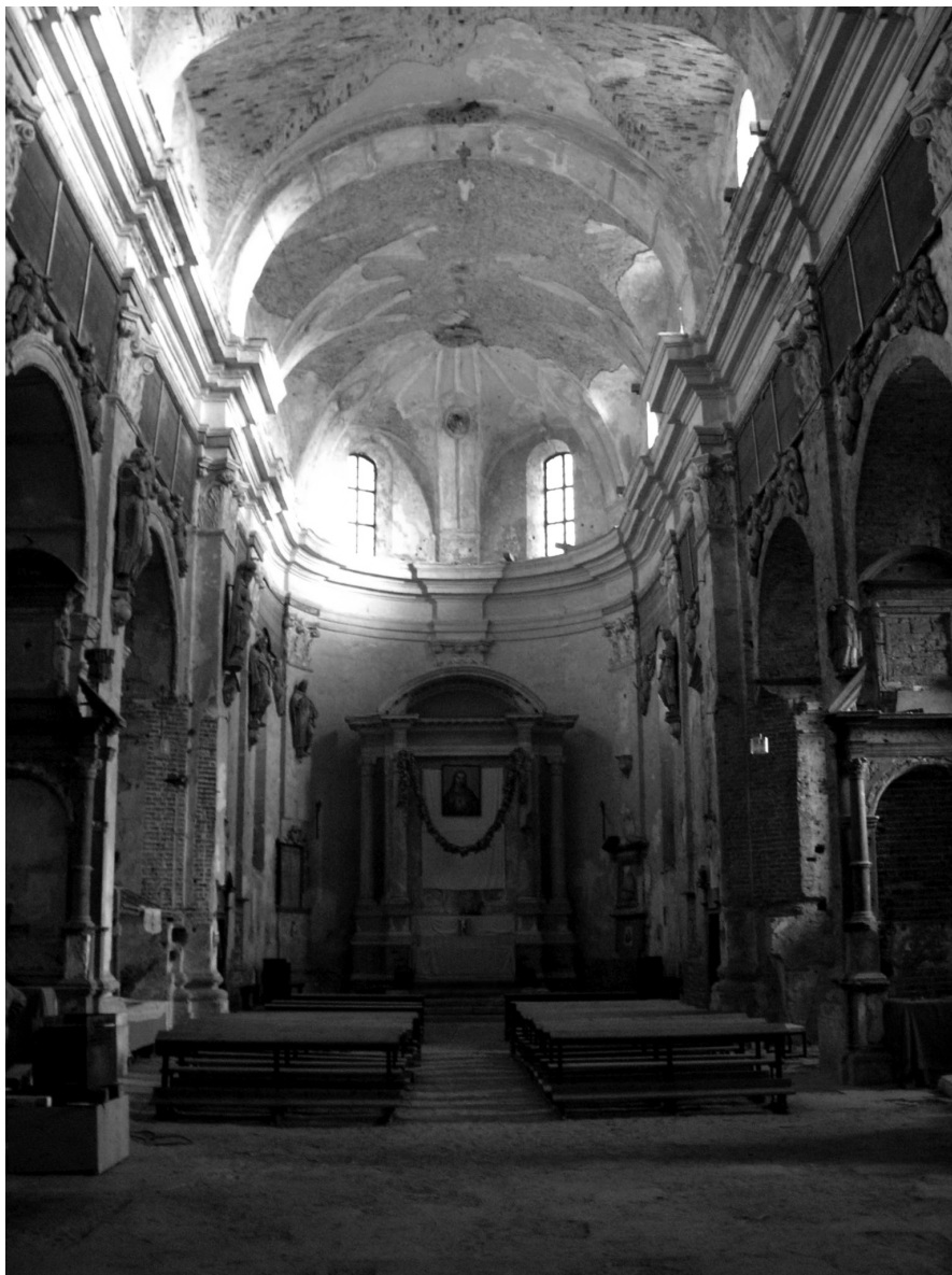
Zniszczone wnętrze prezbiterium, nawy głównej i ołtarzy bocznych, kolegiaty. Fot. Aleksander Smoliński, lipiec 2006 r.