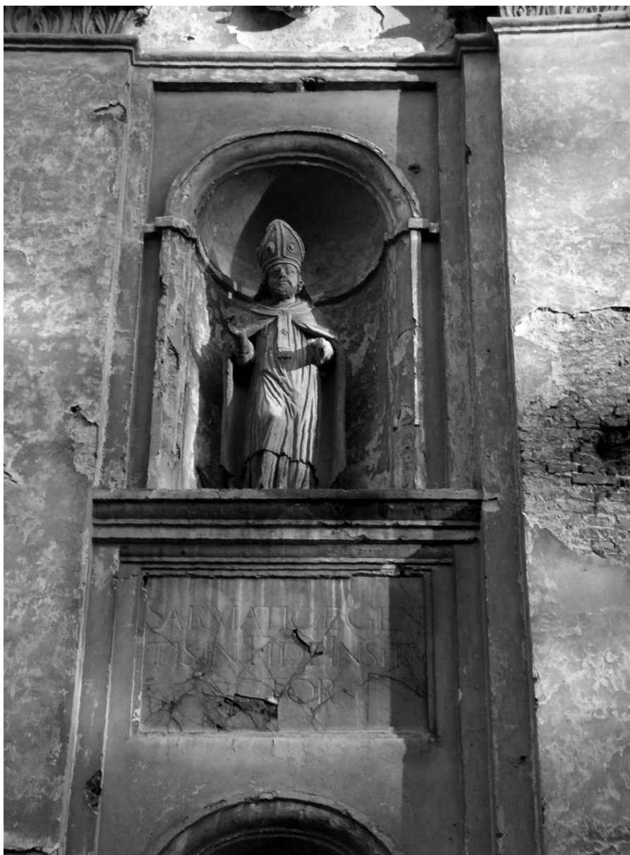
Rzeźba przedstawiająca jednego z dwóch biskupów, których figury zdobią fasadę ołyckiej kolegiaty. Fot. Aleksander Smoliński, lipiec 2006 r.