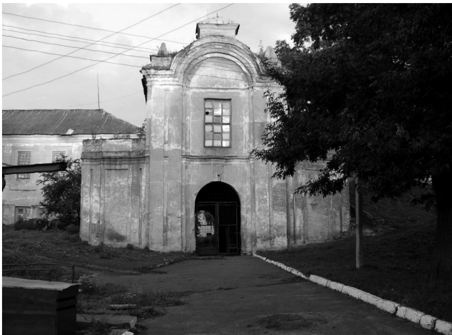
Stan obecny Bramy Wjazdowej zamku w Ołyce. Fot. Aleksander Smoliński, lipiec 2006 r.