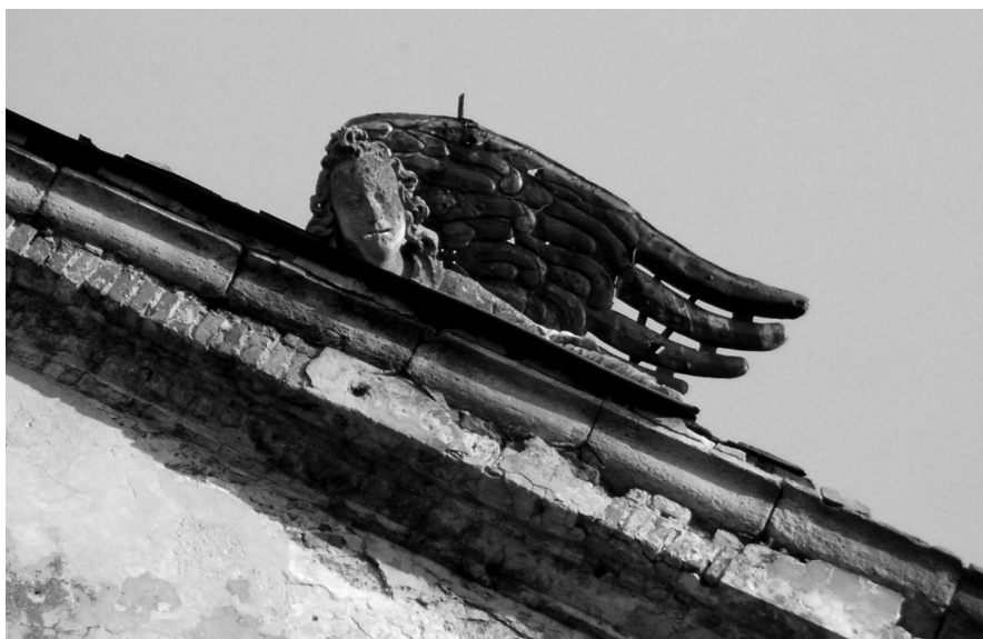
Figura prawego (dla obserwatora stojącego przed fasadą lewego) leżącego anioła znajdująca się ponad gzymsem tympanonu kolegiaty. lipiec 2006 r.