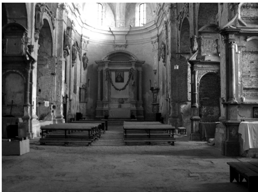
Zdewastowane prezbiterium i część nawy głównej ołyckiej kolegiaty. lipiec 2006 r.