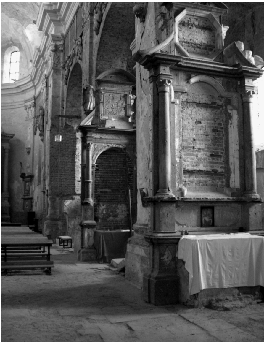
Zniszczone ołtarze boczne oraz nagrobki w kolegiacie. lipiec 2006 r.