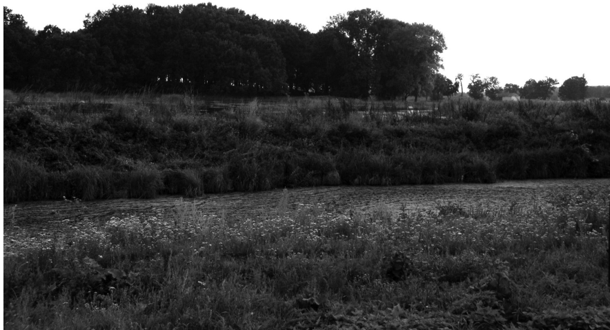
Widok podmokłego terenu wokół radziwiłłowskiego zamku w Otyce. lipiec 2006 r.