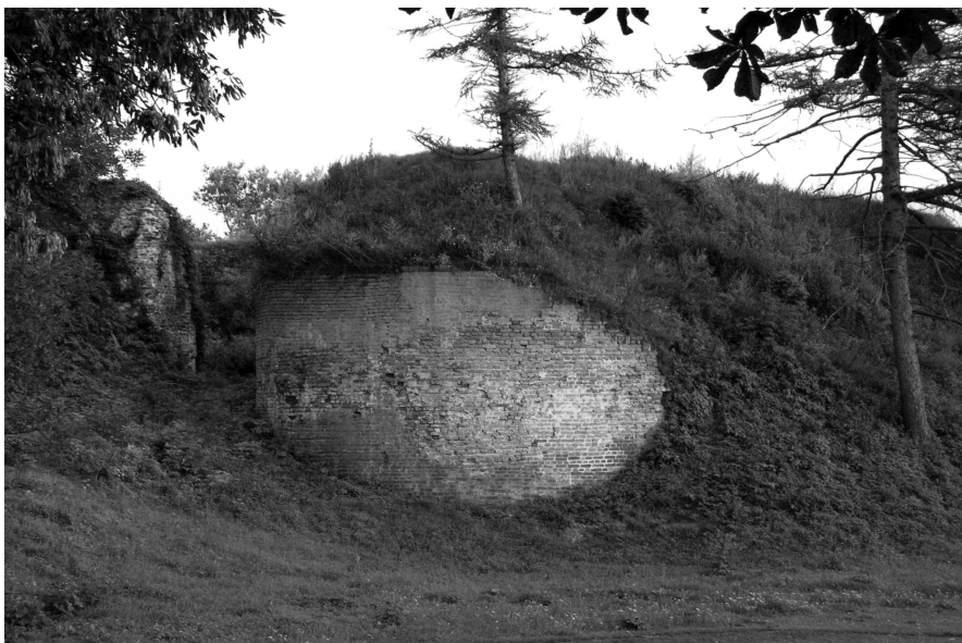
Pozostałości dawnych ziemnych fortyfikacji bastionowych ołyckiego zamku. Fot. Aleksander Smoliński, lipiec 2006 r.