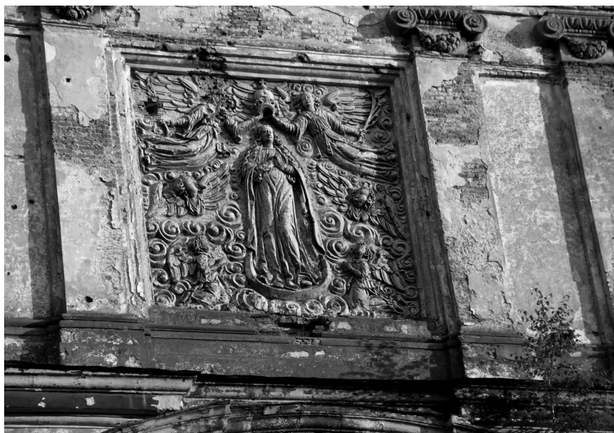
Parawanowy szczyt kolegiaty z prostokątnym polem frontonu z płaskorzeźbą ukazującą scenę Ukoronowania Najświętszej Maryi Panny. Fot. Aleksander Smoliński, lipiec 2006 r.