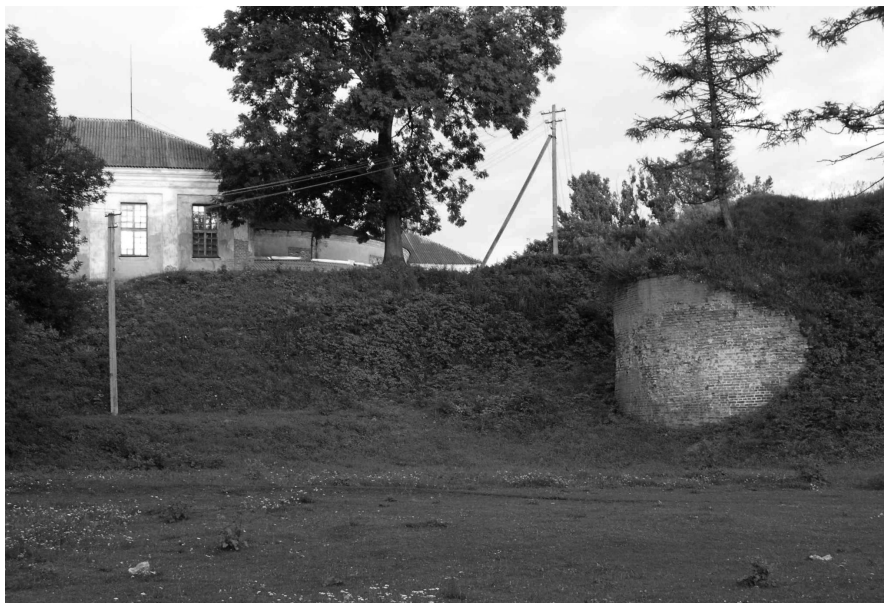
Pozostałości dawnych ziemnych fortyfikacji bastionowych ołyckiego zamku – inne ujęcie. Fot. Aleksander Smoliński, lipiec 2006 r.