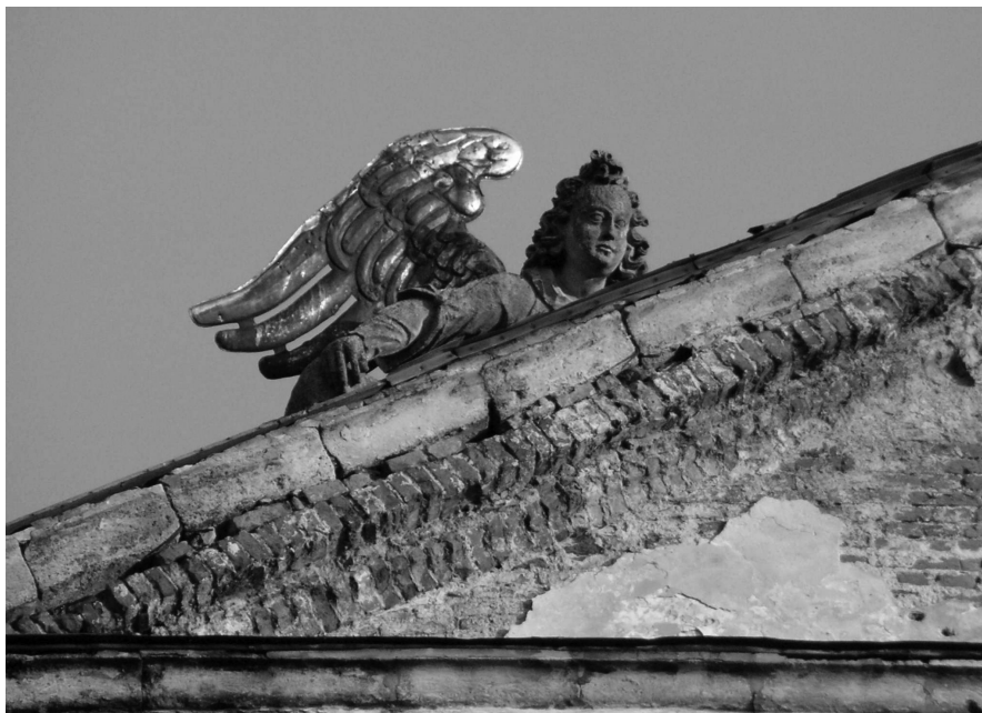
Figura lewego (dla obserwatora stojącego przed fasadą prawego) leżącego anioła znajdująca się ponad gzymsem tympanonu kolegiaty. Fot. Aleksander Smoliński, lipiec 2006 r.