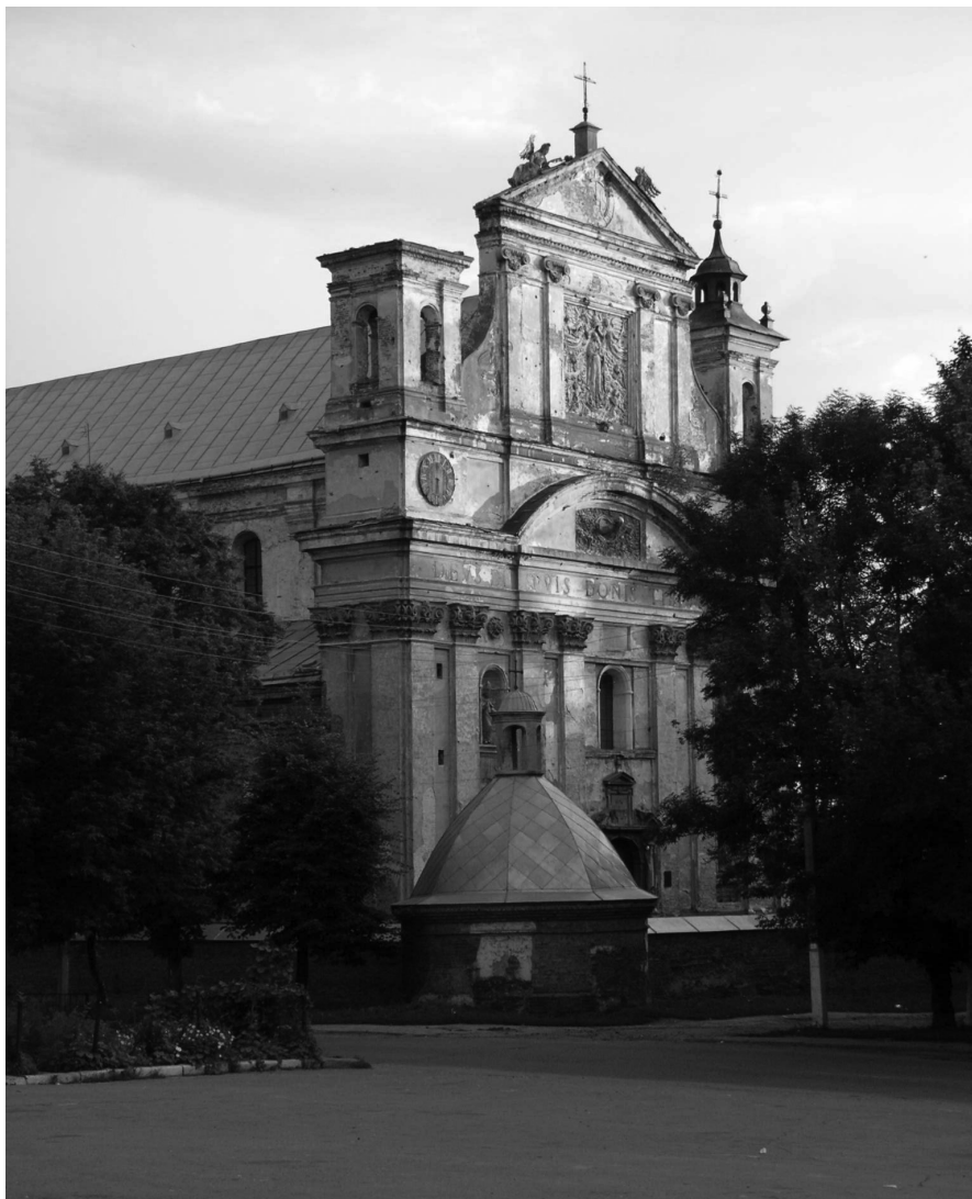
Ogólny widok fasady i korpusu kolegiaty pw. Świętej Trójcy. Fot. Aleksander Smo- liński, lipiec 2006 r.