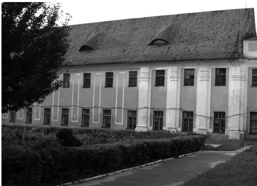
Obecny kształt jednego ze skrzydeł otyckiego zamku. Fot. Aleksander Smoliński, lipiec 2006 r.