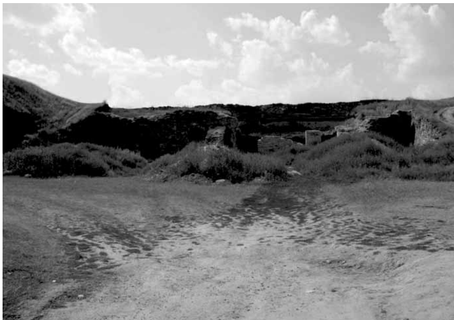
Pozostałości ziemnych fortyfikacji Nowego Zamku. Zniszczone kazamaty – stan z 2008 r.