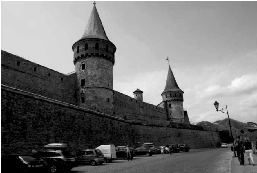
Odrestaurowywany kryty ganek łączący Basztę Różanka z Basztą Lanckorońską, którego odcinek dochodzący do Baszty Komendanckiej udostępniony został zwiedzającym. Stan z 2013 r.