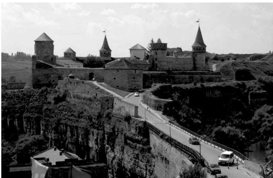
Ogólny widok wschodniej i północnej części Starego Zamku. Dobrze widoczne są Baszty Papińska i Nowa Wschodnia Baszta oraz Baszty Lanckorońska i Komendancka, a także kamienny Most Turecki łączący miasto z zamkiem oraz pozostałości Nowego Zamku – stan obecny.