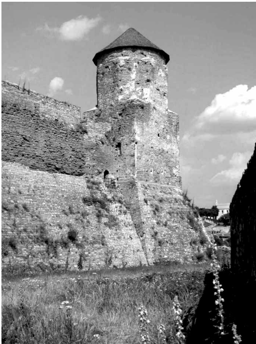
Południowa część Starego Zamku. Dobrze widoczna jest Baszta Papińska – stan obecny.