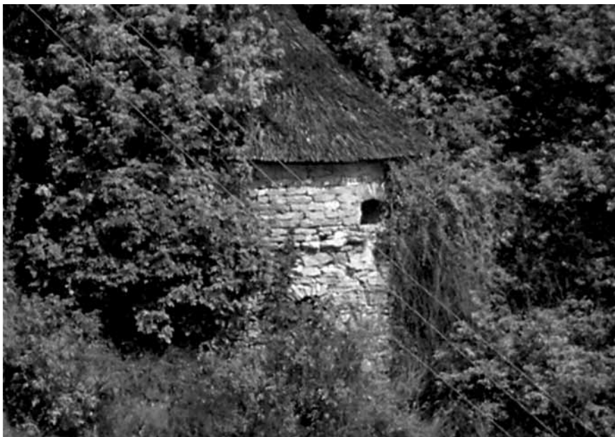
Brama Ruska – wieża strażnicza znajdująca się przed bramą, po jej północnej stronie – stan obecny.