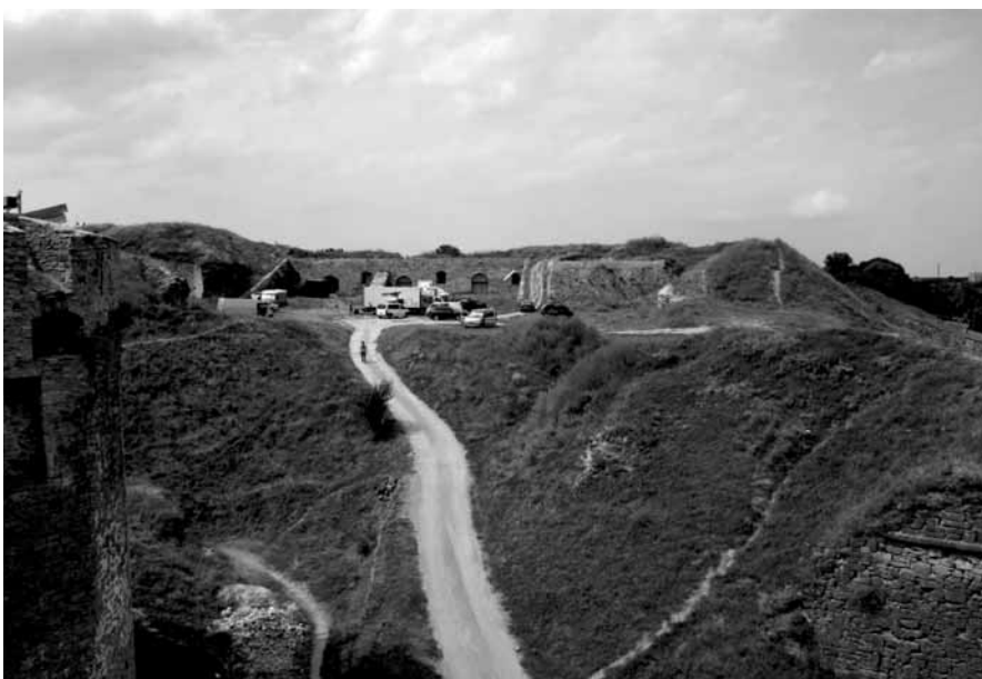
Kazamaty fortyfikacji Nowego Zamku w trakcie prac restauracyjnych i rewitalizacyjnych – stan z 2013 r.