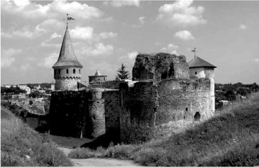
Ogólny widok zachodniej części Starego Zamku obserwowanego z wałów Nowego Zamku. Dobrze widoczne są resztki Małej Baszty oraz Nowa Zachodnia Baszta, a także stojąca na prawo od tej ostatniej Baszta Lacka – stan obecny.