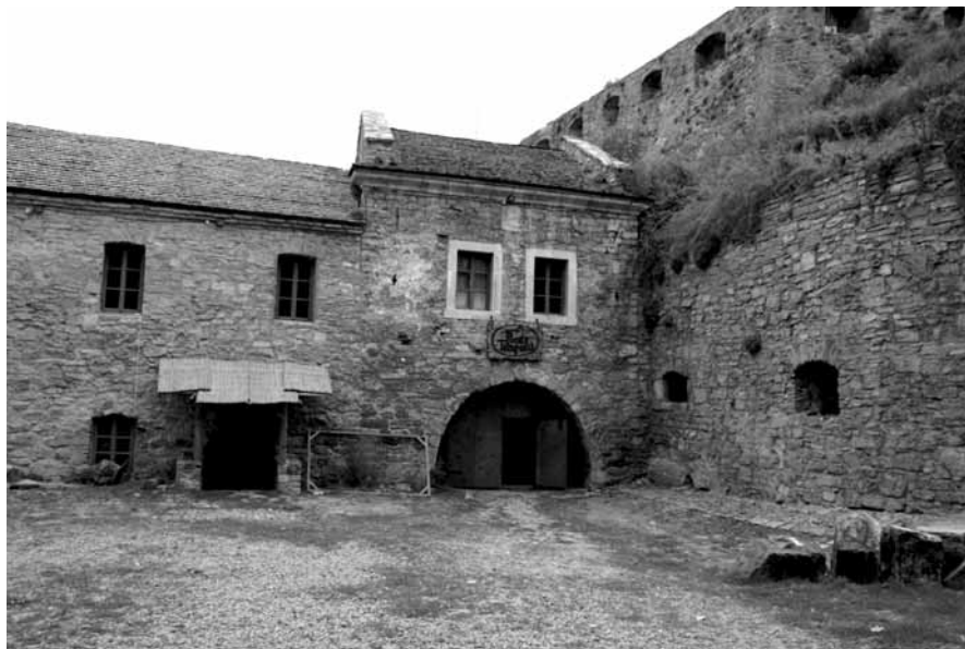
Brama Ruska po zakończeniu podstawowych prac konserwatorskich i rewitalizacyjnych – stan z 2013 r.