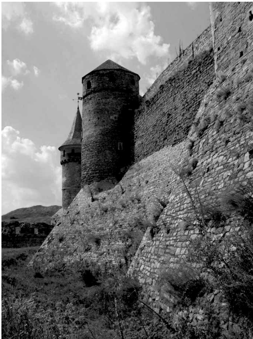
Południowa część Starego Zamku. Dobrze widoczna jest Baszta Kołpak oraz fragment stojącej za nią Baszty Tęczyńskiego – stan obecny.