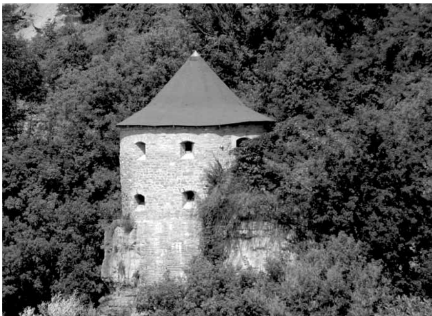
Widok ogólny na Wieżę przy Brodzie – stan obecny.