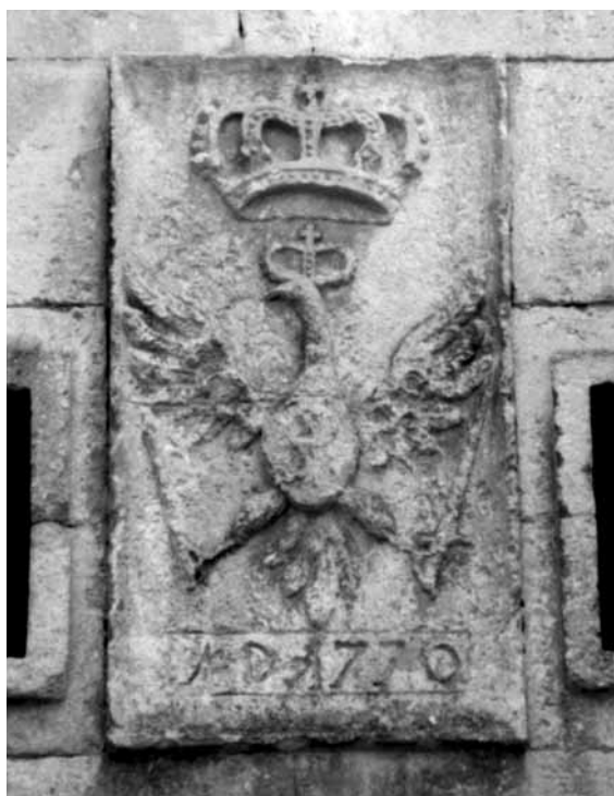
Brama Ruska – pochodzący z XVIII w. polski orzeł z herbem Poniatowskich Ciołek na piersi, umieszczony nad przejazdem od jej wewnętrznej strony – stan z 2007 r.