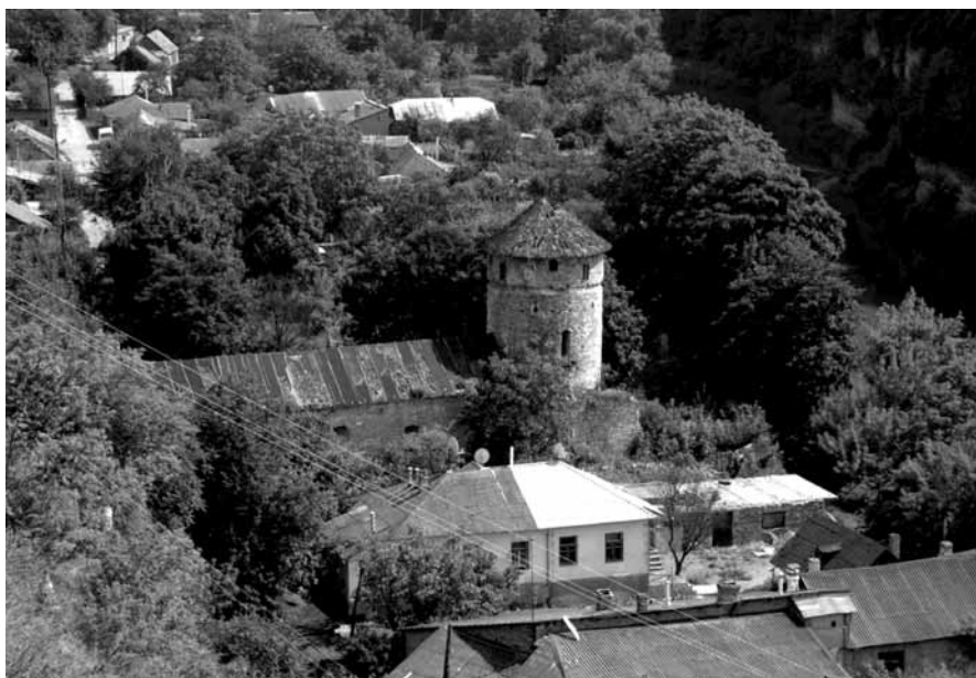
Widok ogólny na Bramę Ruską – widać jedynie część tego obiektu, a mianowicie Basztę Przybrzeżną i kazamaty – stan z 2008 r.