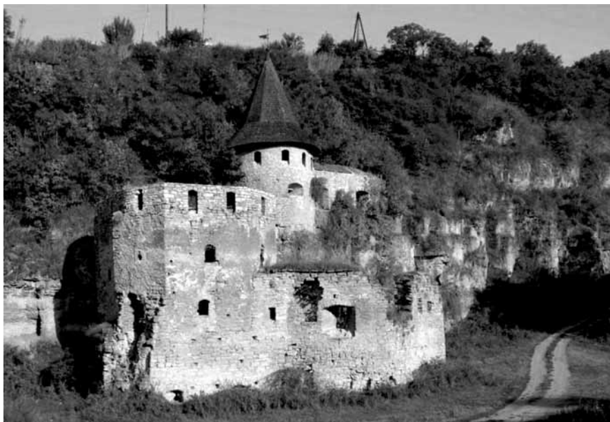
Brama Lacka (Polska). Widoczne wieże, barbakan oraz mury obronne – stan z 2008 r.