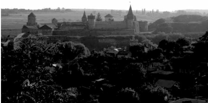
Ogólny widok murowanego Starego Zamku oraz pozostałości ziemnego Nowego Zamku w Kamieńcu widzianych od strony północnej – stan z 2008 r.