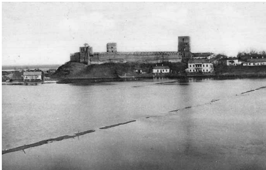
Łuck. Zamek Lubarta od strony rzeki Styr, Przemysław [1930–1937], pocztówka ze zbiorów Muzeum Niepodległości w Warszawie, nr inw. MN P-3271

Istotnie za jakiś czas, pociąg wtoczył się na stację. Zobaczyłam długi drewniany budynek, śniegu ani śladu, raczej błoto. Byłam trochę rozczarowana tak małą stacją, wyobrażałam sobie solidny, jasny, piętrowy budynek 6 . Wsiadliśmy do dorożki i dojechaliśmy na przedmieście Krasne 7 , gdzie brat mieszkał przy uliczce bocznej od ul. Szewczenki, w schludnym parterowym domku, odnajmując od właściciela Czecha 8 dwa pokoje z kuchnią i szo-