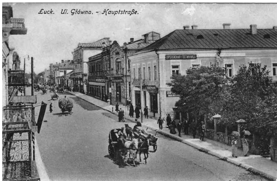
Łuck. Ulica Główna, po odzyskaniu niepodległości w 1918 r. przemianowana na ulicę Jagiellońską, Łuck 1916, pocztówka

śnie, a w sumie jakoś dziwnie się czułam. Podniecona, patrzyłam przez okno, ale nic dojrzeć nie mogłam. Prawdopodobnie zdrzemnęłam się bo poczułam jak brat delikatnie poruszył moją rękę i cicho powiedział – obudź się, tu wysiadamy. Była jeszcze głucha noc, okazało się, że musimy się przesiąść na tej stacji (Czeremcha 5 ) do pociągu, który szedł bezpośrednio do Łucka. Siedzieliśmy w poczekalni, zimno mi było, zapomniałam dodać, że to było 1 lutego noc z 1 na 2 luty, a tam zima była zawsze prawdziwą zimą, dużo śniegu i mróz. Wreszcie przyszedł pociąg i wsiedliśmy do I klasy, gdyż było tłoczno, podejrzewam jednak, że brat widząc moje zmęczenie chciał żebym się trochę położyła i tak też się stało. Obudził mnie gwar i rozmowa. Podniosłam się, już było zupełnie widno. Brat rozmawiał z jakimś panem, ale zobaczył, że usiadłam [więc] powiedział: idź do toalety umyć się – dojeżdżamy.