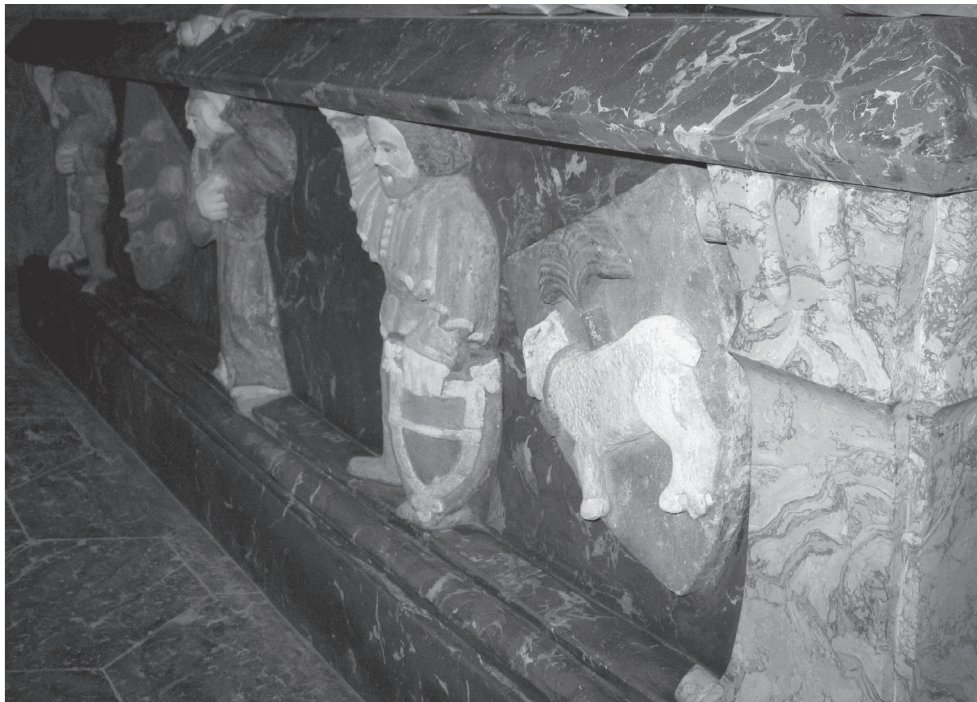
Представления з једней з бочных ścian тумбы Болка II Маłego (zm. 1368), оѕатniego Пяста świdnickiego, з опactwa pocysterskiego в Krzeszowie (II poł. XIV w.); фот. Аутора.