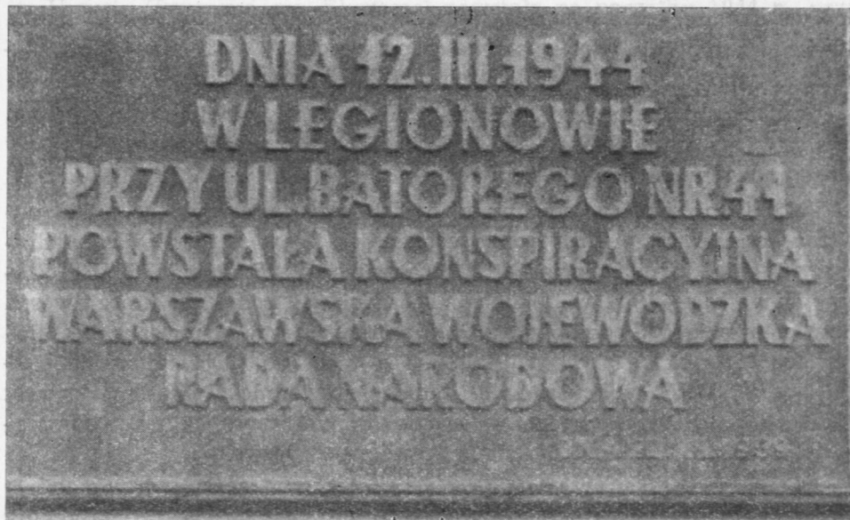
Ryc. 4. Tablica na ścianie domu w Legionowie przy ul. Batorego 41, informująca, że 12 marca 1944 r. powstała w Legionowie konspiracyjna Warszawska Wojewódzka Rada Narodowa

W kwietniu 1944 r. stwierdzono, że działalność WRN objęła w dystrykcie warszawskim 10 powiatów, że zdołano utworzyć 3 powiatowe i 15 gminnych rad. W wielu miejscowościach rady były w stadium organizacji 13 . O rozmachu działalności organizacyjnej świadczy także i to, że Wojewódzka Rada wydawała swój konspiracyjny organ „Głos Ludowy”. Zachował się, niestety, tylko jeden egzemplarz tego pisma, z 1 stycznia 1945 r. 14 Dla terenów prawobrzeżnych drukowano na powielaczu w 1944 r. „Myśl Chłopską”, której podtytuł brzmiał: „Organ porozumienia robotniczo-chłopskiego” 15 . Ponadto Powiatowa Rada w Łowiczu od kwietnia 1944 r. do stycznia 1945 r. wydawała na powielaczu pismo pt. „Piorun” 16 .