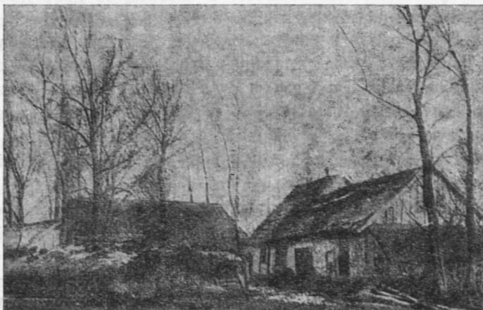
Ryc. 8. Zabudowania w Teodorowie gm. Staroźreby pow. Płock, miejsce ukonstytuowania się konspiracyjnej Płockiej Wojewódzkiej Rady Narodowej