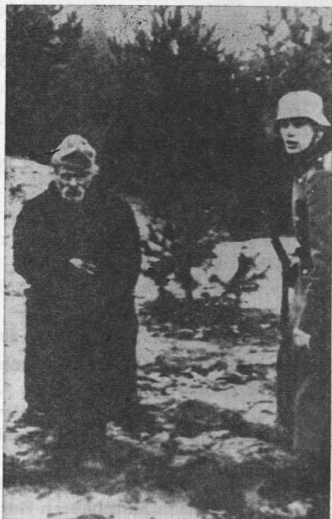
Ryc. 1. Zagłada ostrowskich Żydów, 11 XI 1939. Ludobójca i ofiara. Zdjęcie niemieckie.