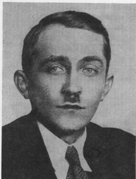
Ryc. 33. Wawrzyniec Polikarp Suchcicki