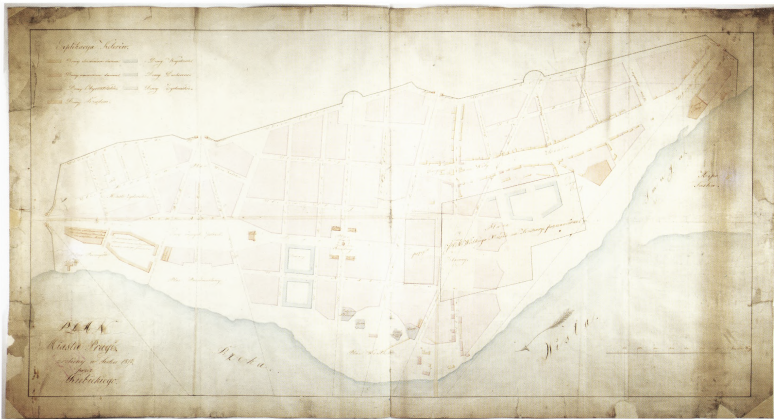
5. Plan miasta Pragi zrobiony w roku 1817 J[akuba] Kubickiego