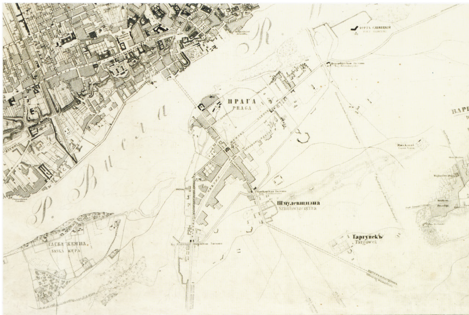
8. Plan miasta Warszawy i okolic, 1856 r. (fragment mapy ukazujący prawobrzeżne terytoria przedmiejskie)