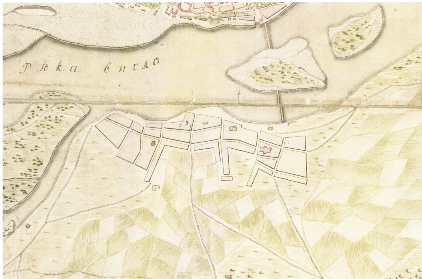
1. Plan głównego w mazowieckim województwie miasta i rezydencji królowej polskiej Warszawy [...], 1732 r., (fragment mapy ukazujący część zabudowaną prawobrzeżnych terytoriów przedmiejskich) AGAD, Zb. Kart 86-16