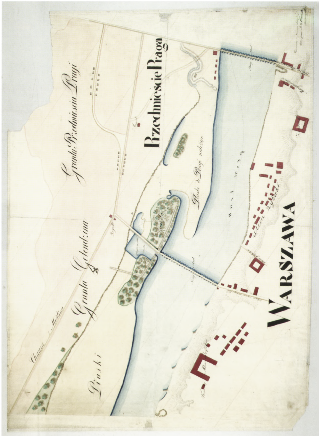
6. Plan Wisły od Pieńkowa do Warszawy, sekcja IV: od Pólkowa do nowego mostu w Warszawie, 1830 r. AGAD, Zb. Kart. 297-18