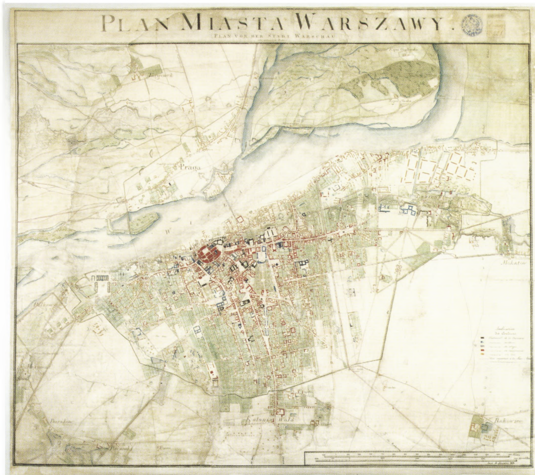
3. Plan miasta Warszawy, 1809 r.