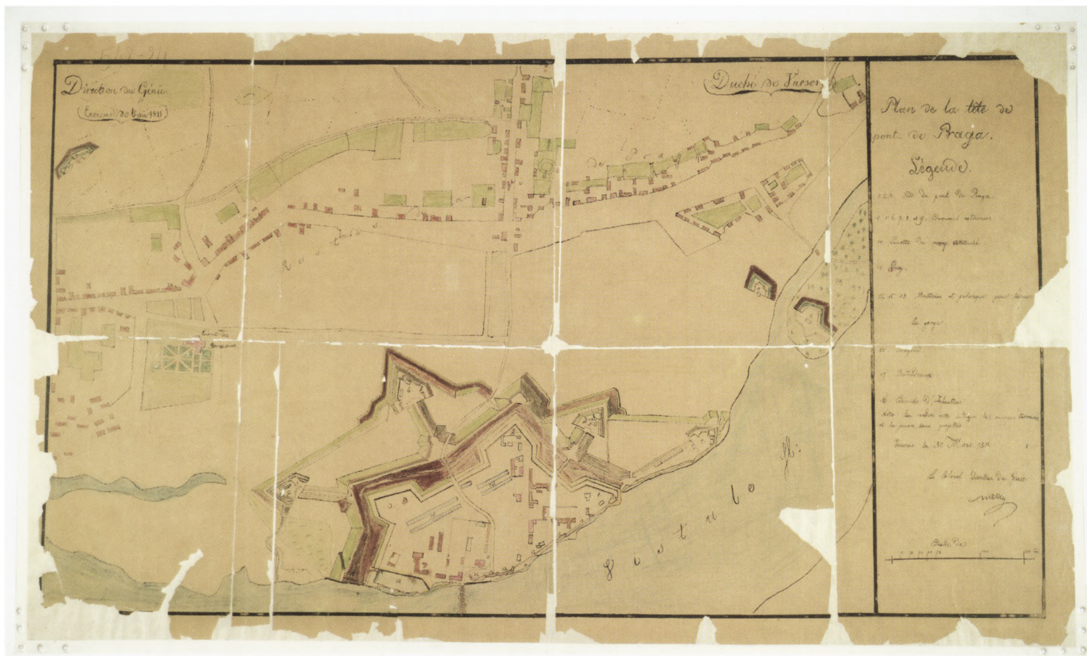
4. Plan de la tête de pont de Praga, 1811 r.