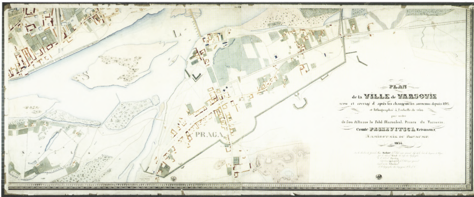
7. Plan de la ville de Varsovie [...], 1837 r. (fragment mapy ukazujący prawobrzeżne terytoria przedmiejskie) AGAD, Zb. Kart 92-7