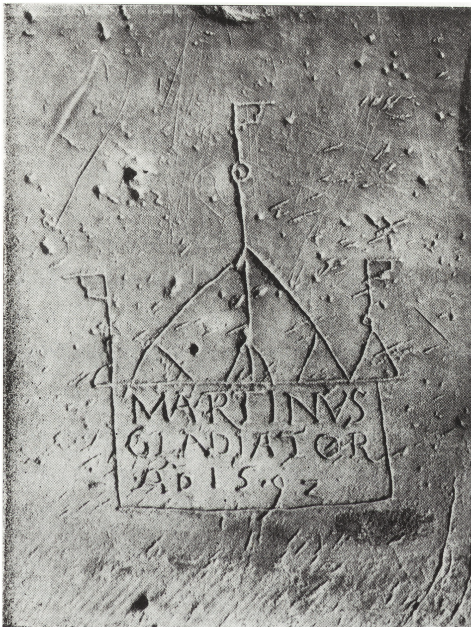
Ryc. 2. Ryt Martinusa Gladiatora z rytym wyobrażającym rycerza