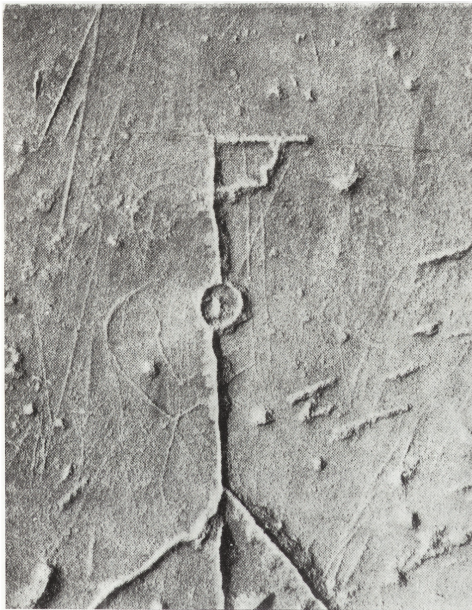
Ryc. 3. Ryty rysunek wyobrażający rycerza (fragment ryc. 2)