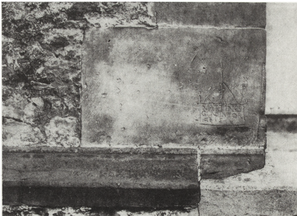
Ryc. 1. Cios z rytym Martinusa Gladiatora z 1592 r.

rycerza w zbroi. Technika rytu odbiega zasadniczo od rysunków architektonicznych wykonanych szerokimi, głęboko rytymi liniami. Cios z rytym wyobrażającym rycerza znajduje się w narożu północnej (licząc od osi kościoła) przyporze prezbiterium, bezpośrednio nad rozszerzającym się ku dołowi cokołem. Cios ów, wykonany podobnie jak inne z szarego miejscowego piaskowca, posiada 83 cm długości oraz 52 cm wysokości. W jego prawym dolnym narożu znajduje się przedstawienie budowli, wyobrażające obiekt zwieńczony attyką zasygnalizowaną rzędem niezgrabnie i asymetrycznie wykonanych trójkątnych szczyków oraz przykryty wysokim dwuspadowym dachem. Na szczycie dachu widnieje wysoki maszt zakończony chorągiewką; podobne chorągiewki znajdują się również na narożnych szczykach attyki. Prostokąt frontowej ściany budowli wypełnia umieszczona w trzech rzędach inskrypcja: MARTINVS GLADIATOR A D 1592. Długość rytu wynosi 19,5 cm, wysokość 30,5 cm. Marginesowo należy dodać, że twórca rytu Martinus Gladiator (Marcin Miecznik), uczeń miejscowej szkoły parafialnej 5 , został mylnie włączony przez Stanisława Łozę w poczet architektów i budowniczych działających w Polsce 6 .