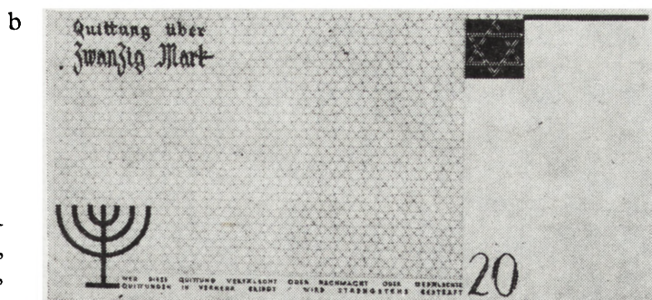
Ryc. 4. Banknot dwudziestomarkowy, 1940 r., getto łódzkie (a. awers, b. rewers)