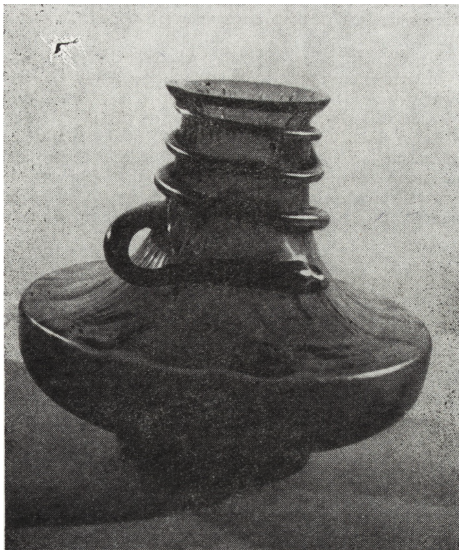
Ryc. 13. Wazon, Czechy, pocz. XX w., nr inw. MNKi/R/1586

Czeską secesję reprezentuje kilka eksponatów. Najpiękniejszy niewątpliwie jest wazon z zielonego szkła (poz. 2), którego wąską szyjkę oplata wałek szklany w kształcie węża. Powierzchnia wazonu nieznacznie puklowana, z delikatnymi guzami, mieni się i wiruje dzięki iryzacji. Pochodzi najprawdopodobniej z huty Loetz-Witwe w Klostermühle (Klášterský Mlýn) w Czechach Zachodnich.