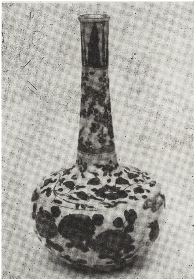
Ryc. 18. Wazon, Chiny, XVII/XVIII w., nr inw. MNKi/R/1616

Cybulski. Obie wyrażają sentyment znajdujących się pod rozbiorami Polaków do walczącej Francji (okres wojny francusko-pruskiej i Komuny Paryskiej, w których brało udział wielu Polaków). Odżyły wtedy tradycje napoleońskie i republikańskie.