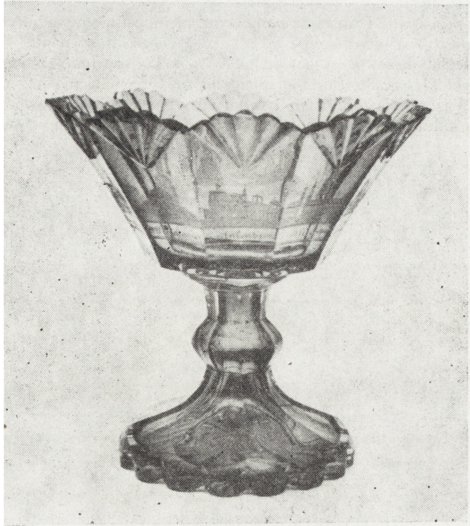
Ryc. 15. Patera, Czechy, poł. XIX w., nr inw. MNKi/R/1620

piękny korpus mocno wydłużony, rozszerzający się płynnie ku górze, wsparty na szerszej kolistej stopce. Na zielone tło o zróżnicowanych odcieniach nałożono brązową trawioną dekorację przedstawiającą pejzaż nadwodny z wysokim rozgałęzionym drzewem na pierwszym planie i ścianą zarośli zamykającą tło. Ornament wydobyty jednostopniowym trawieniem jest tu w przeciwieństwie do poprzedniego przykładu płaski i dekoracyjny (tam — dzięki kilkustopniowym trawieniom uzyskano efekt głębi). Zewnętrzna brązowa warstwa o ciemniejszych i jaśniejszych odcieniach, miejscami przeświecająca, przy podstawie i na stopce najbardziej intensywna.