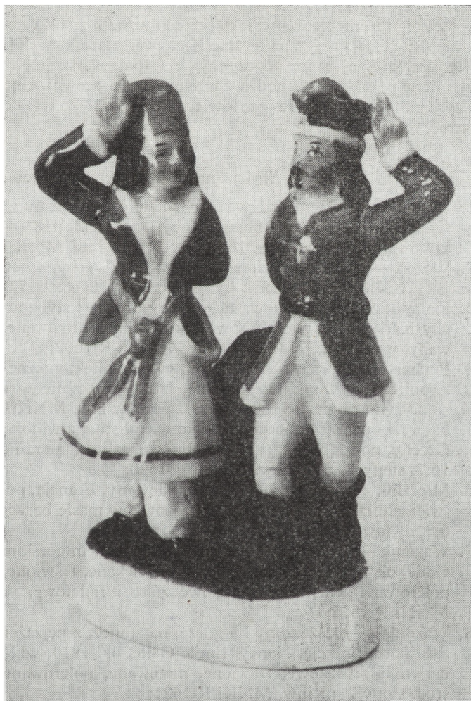
Ryc. 19. Figurka, Ćmielów, 1863–1887, nr inw. MNKi/R/1621

Zabytkowe tkaniny wzbogacił tylko jeden, ale bardzo ciekawy przykład. Jest to kobierczyk perski z ok. poł. XIX w. (poz. 15) o bardzo wysmakowanej, świetnie zachowanej kolorystyce, świadczącej o użyciu jeszcze barwników naturalnych