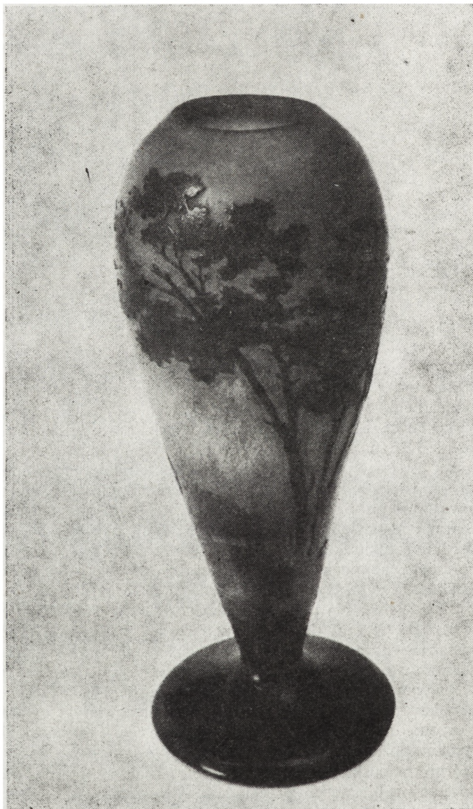
Ryc. 16. Wazonik, Francja, ok. 1910, nr inw. MNKi/R/1624

(bezbarwne i zmacone pionowymi zielono-fioletowo-żółtymi smugami) ukazano dwa nieco zróżnicowane pejzaże: leśny z wysokimi sosnami i brzeg lasu z zamykającą tło ścianą krzewów i zarośli. Tło matowe trawione, motywy dekoracyjne wypukłe, gładkie, podkreślone emaliami w różnych odcieniach żółci, zieleni, brązu i czerni. Wazonik jest dobrym przykładem zręcznego wzorowania się małych warsztatów produkujących szkło dekoracyjne na wyrobach słynnych wytwórni (poz. 10).