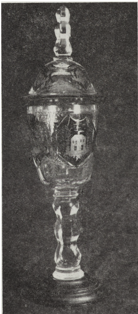
Ryc. 14. Puchar z nakrywą, Śląsk — Sudety, 2. poł. XIX w., nr inw. MNKi/R/1613

Najciekawsze zakupy ze szkła pochodzą jednak z Francji i powstały w najsłynniejszych wytwórniach szklarskich epoki secesji: Emila Gallégo i Braci Daum w Nancy. Dwa wazoniki z warsztatu Gallégo pochodzą z ok. 1910 r. Szczególną finezję wykonania obserwować można w wazoniku o kulistym brzuscu, przedstawiającym rozległy pejzaż górski (poz. 7). Widok o zróżnicowanych kolorystycznie i odcieniami kilku planach (grupy drzew, jeziora, zarośla i w tle wysokie szczyty górskie) ukazany jest na tle poziomych żółto-fioletowych cieni. Dekoracja trawiona z niezwykłą precyzją zachowuje światłocieniowy modelunek zarówno w partii pierwszoplanowej, jak i tła. Wazonik z krajobrazem nadwodnym (poz. 8) posiada