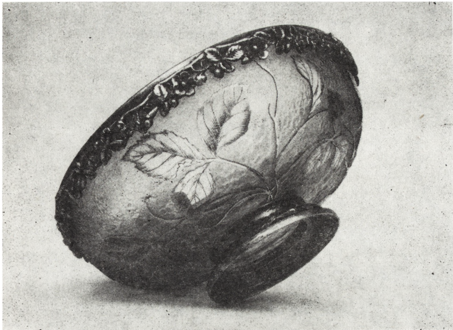
Ryc. 17. Patera, Francja, 1891–1895, nr inw. MNKi/R/1608

Zbiory ceramiki kieleckiego muzeum wzbogaciły się o 26 eksponatów. Najstarszy, bo pochodzący z przełomu wieków XVII i XVIII, jest wazon chiński (dynastia Cing, okres K'ang Hsi) wykonany z lekko błękitnawej porcelany, zdobiony podszkliwnie kobaltem (poz. 11). Wazon o szerokim kulistym brzuścu zwęża się ku górze i przechodzi w wąską długą szyjkę. Dekoracja zróżnicowana jest w każdej z czterech stref. W najszerzej partii brzuśca stylizowany pejzaż z fantastycznymi kwiatami (piwonie lub chryzantemy?) i krzewami, między nimi sylwetowo potraktowane ptaki. W miejscu zwężania się brzuśca pas gęstej, mocno splątanej, ulistnionej wici roślinnej z kwiatami i liśćmi artemizji oraz z wkomponowanymi w nią symbolami Cennych Przedmiotów (księgi i lustro — symbol zwycięstwa). Szyjka zdobiona stylizowanym drzewem z gałęziami i kwiatami (motyw kakiemonu), a przy brzegu ujęta w wydłużone liście lancetowe. Wazon ten o kształcie typowym dla ceramiki chińskiej z przełomu XVII i XVIII w., o pięknej zróżnicowanej dekoracji, potwierdzającej najwyższy kunszt techniczny i fantazję twórców Dalekiego Wschodu, dzięki swoim walorom artystycznym wzbogaci ekspozycję wnętrza pałacowych z XVII i XVIII w. o znakomity przykład tak cenionej w tym czasie porcelany chińskiej.