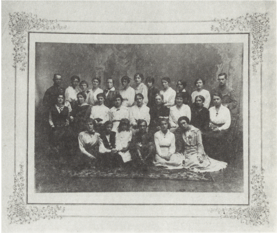
Ryc. 2. Liga Kobiet Pogotowia Wojennego w Kielcach, kat. 98