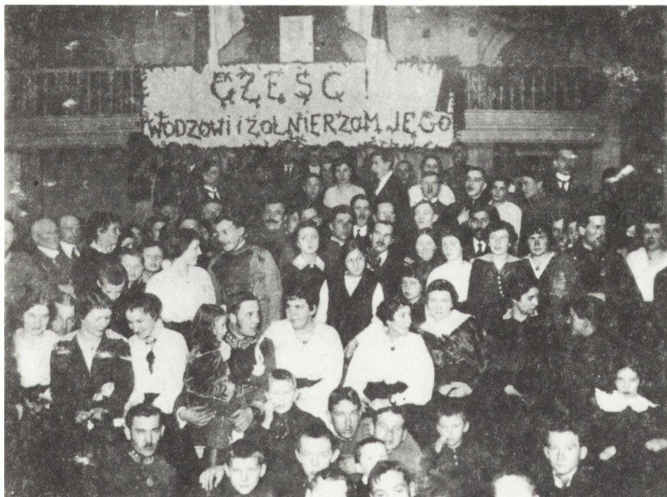
Ryc. 3. Kielczanie uczestniczący we wspólnej wigilii z legionistami w hotelu Bristol 23 XII 1916 r., kat. 100