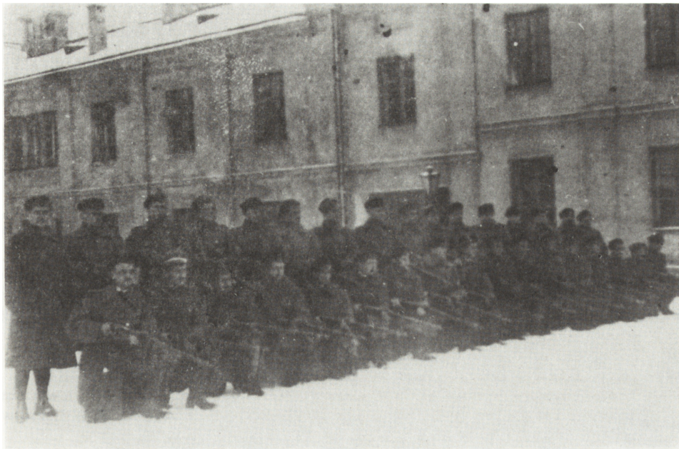
Ryc. 4. Uczniowie klas 5 a i b Szkoły Handlowej w Kielcach w służbie pomocniczej 56 Pułku Piechoty, XI 1918, kat. 108