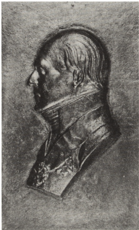
Ryc. 1. Plakietka jednostronna wg Wiliama Kimensa, 1926 r., nr kat. 1