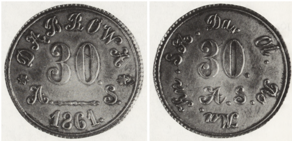
Ryc. 1. Znak rozliczeniowy Dąbrowy, awers i rewers

emisji, rzadko występującą na tej grupie monet. Pomimo to znak ten nie został dotąd umiejscowiony geograficznie i przypisany właściwemu posiadaczowi dóbr ziemskich. Wzmianki o monecie Dąbrowy ukazały się w ciągu ostatnich lat w trzech opracowaniach, w których podano: a) tylko nazwę miejscowości, b) przy nazwie miejscowości znak zapytania, c) dopisek: położenie nie zidentyfikowane 2 . Sądzić należy, że powodem tego jest duża liczba miejscowości o tej samej nazwie. Polski Słownik Geograficzny Królestwa Polskiego wymienia ich ponad 190. Niektórzy kolekcjonerzy przypisywali monetę Dąbrowie Górniczej, prawdopodobnie sugerowali się tym, że była powszechnie znana już w XIX w. jako duży ośrodek górniczo-przemysłowy, posiadający również dobra ziemskie.