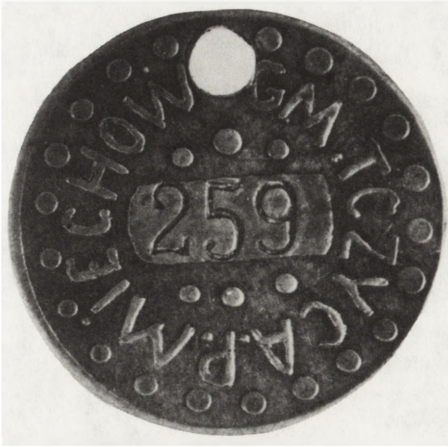
Ryc. 3. Żeton z gminy Tczycza o bliżej nie określonym przeznaczeniu